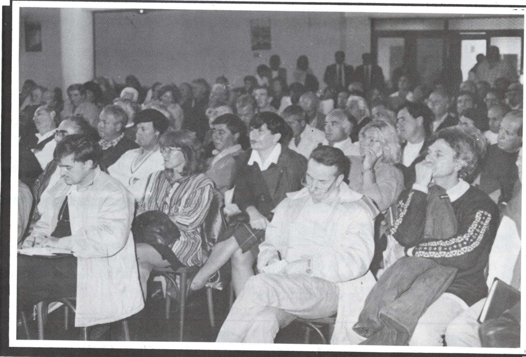
Mar del Plata, 24/04/97 - Aspecto de la concurrencia a la reunión convocada por la empresa ESEBA S.A.