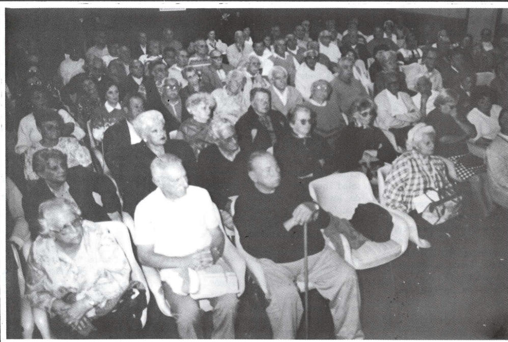
Mar del Plata, 23/04/97 - Asamblea Abierta convocada por la Mesa de Enlace de Jubilados y Pensionados. Asistieron representantes de Centros de Jubilados y público en general. Denuncias de un sector postergado.

Esto no lo elucubramos nosotros, el Sindicato Luz y Fuerza Mar del Plata, esto lo señala la ley, por eso NO ES CIERTO cuando el presidente de ESEBA SA. dice que "otra característica beneficiosa es que los comprendidos dentro de este régimen no perderán el goce del mismo en caso que en el futuro si-