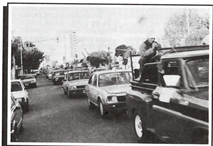
11/02/98. Mar del Plata. Aspectos de la 7ª Caravana Solidaria por las calles de la ciudad.