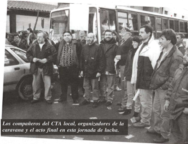
Los compañeros del CTA local, organizadores de la caravana y el acto final en esta jornada de lucha.

La caravana partió a las 16:20 hs. de la sede de la CTA, en Gascón y Tucumán, recorriendo la Av. Independencia hasta J.B. Justo, Edison, Fortunato de la Plaza, Juramento, Génova, Talcahuano, nuevamente F. de la Plaza, Av. Peralta Ramos, nuevamente la Génova, Tetamanti, Ruta 88, Juan B. Justo, Av. Allió, Av. Colón, Errea, Libertad, Mitre, Av. Luro hasta nuestro Sindicato, donde se realizó el acto de clausura. Se fueron realizando diversas paradas en las esquinas de Edison y 12 de Octubre, en barrio Puerto; Tetamanti y Vértiz, barrio El Gaucho; y Bolívar y Errea, barrio Las Lilas, donde se habló con los vecinos y se realizaron pequeños actos relámpago.