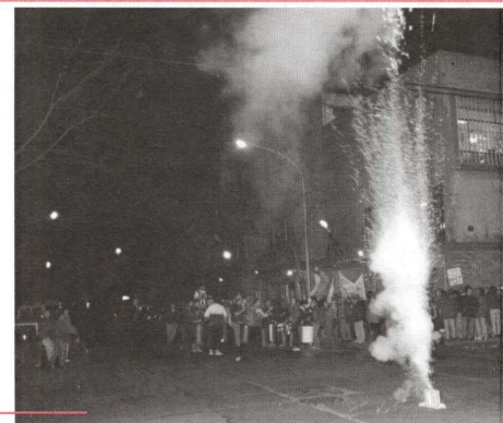
Luego de la gran Caravana por las calles de la ciudad, los compañeros fueron recibidos por bombas de estruendo y murgas en la Sede de nuestro gremio.