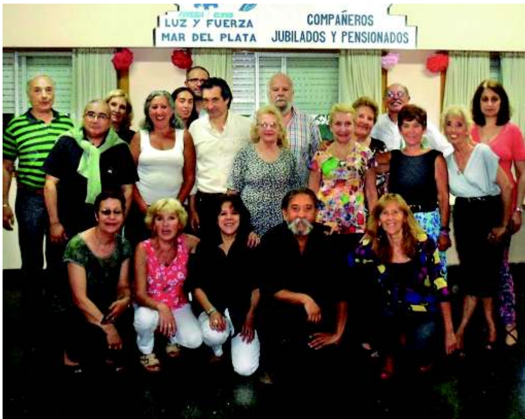
Tango y Salsa

Desde muy antiguo, la danza ha jugado un papel muy importante en la vida de los pueblos. Distintas civilizaciones incorporaron la danza a rituales, ceremonias y festividades. Muchas naciones siguen cultivando hoy en día sus danzas regionales, con motivo de preservar las costumbres e identidad de un país. Podríamos escribir mucho sobre su historia y alcances, sobre su desarrollo y función social y llenaríamos las páginas de varios libros, solamente dedicándonos a su implicancia en nuestra patria. Sin tratar de presumir de erudición, trataremos de abocarnos en esta nota, a los beneficios que arroja la práctica de esta actividad, tanto en lo social, lo físico y lo emocional. Los últimos estudios serios que se han realizado al respecto, coinciden en que cada día hay más