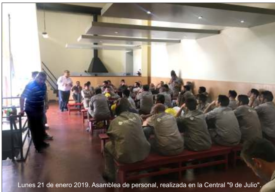
Lunes 21 de enero 2019. Asamblea de personal, realizada en la Central "9 de Julio".

En las próximas semanas, luego de que se terminen de elegir los Delegados en cada sector, se realizará una reunión de Delegados de Guardia y Mantenimiento en el Sindicato para analizar los pasos a seguir.