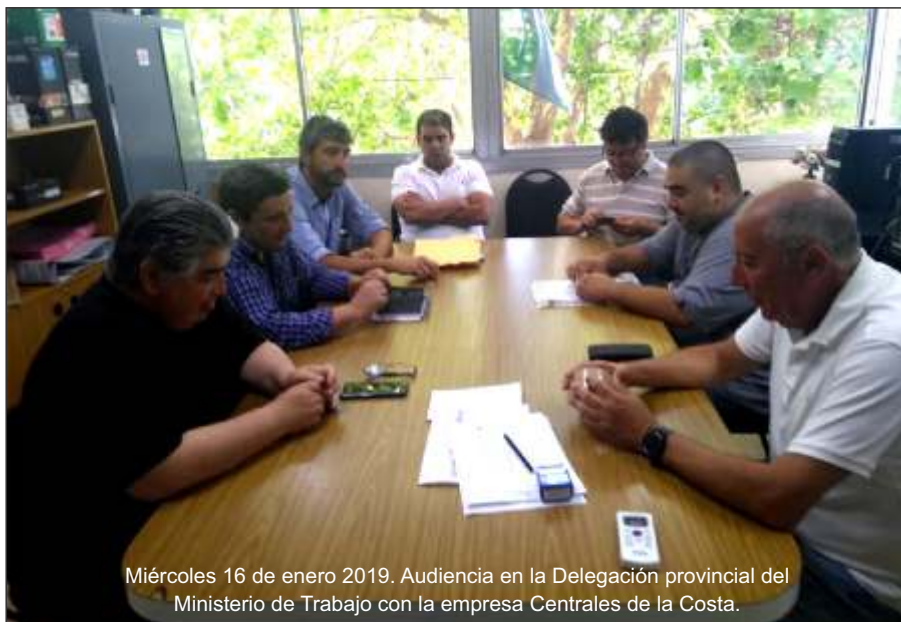
Miércoles 16 de enero 2019. Audiencia en la Delegación provincial del Ministerio de Trabajo con la empresa Centrales de la Costa.

Además, reafirmamos el reclamo por las Bonificaciones, reconocimientos por antigüedad y que se equipare la Bonificación RAG entre los sectores de Técnicos y Administrativos.