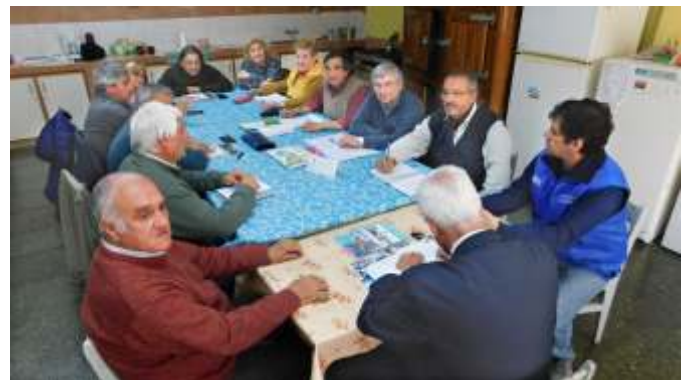
24-10-19. Primera reunión de las nuevas autoridades, con integrantes de la Comisión Directiva del Sindicato.