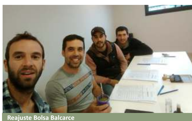
Reajuste Bolsa Balcarce