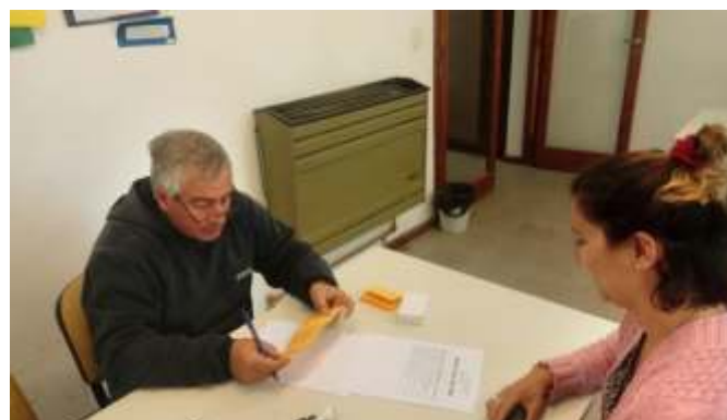
Reajuste Santa Clara