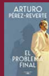
"El problema final" de Perez Reverte