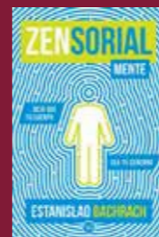
"Zensorialmente" de E. Bachrach