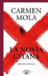
"La novia gitana" de Carmen Mola