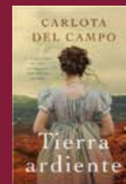
"Tierra ardiente" de Carlota del Campo