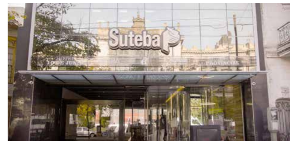
ARRIBA: Hotel del gremio en Tigre. ABAJO: Hotel del gremio en La Plata.