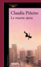
"La muerte ajena" Claudia Piñeiro