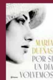
"Por si un día volvemos" María Dueñas