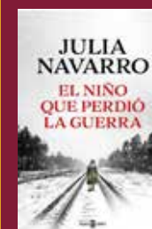
"El niño que perdió la guerra" Julia Navarro