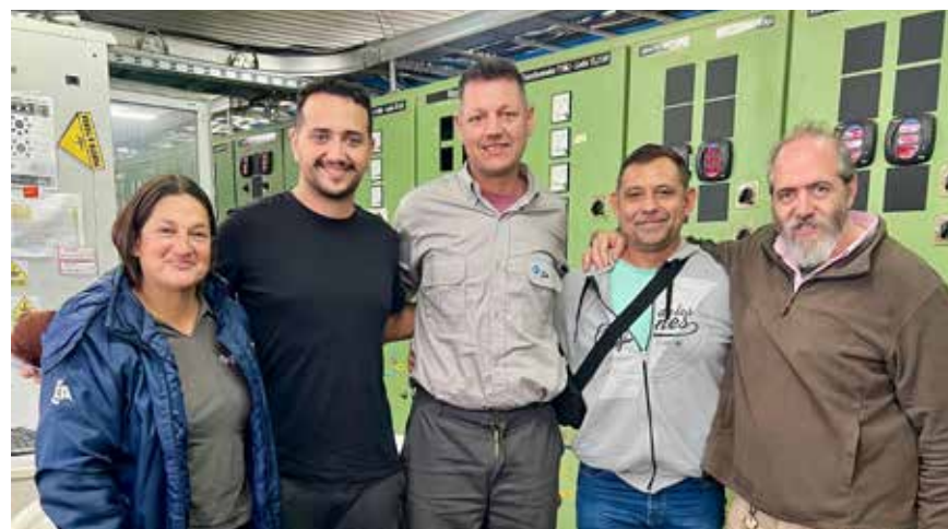
TRANSBA - MAR DE AJÓ

Para cerrar esa jornada, realizamos una reunión con los compañeros de esta localidad. Abordamos distintos temas vinculados al plantel y las re categorizaciones que venimos trabajando para dar respuesta al crecimiento de los usuarios en la zona. También se habló del salario que es otro punto que está en discusión en este marco paritario con las autoridades.