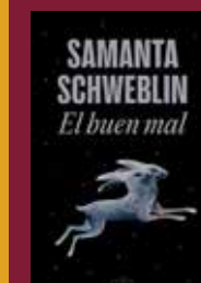
"El buen mal" Samanta Schweblin