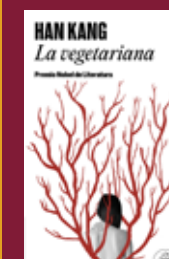
"La Vegetariana" Han Kang