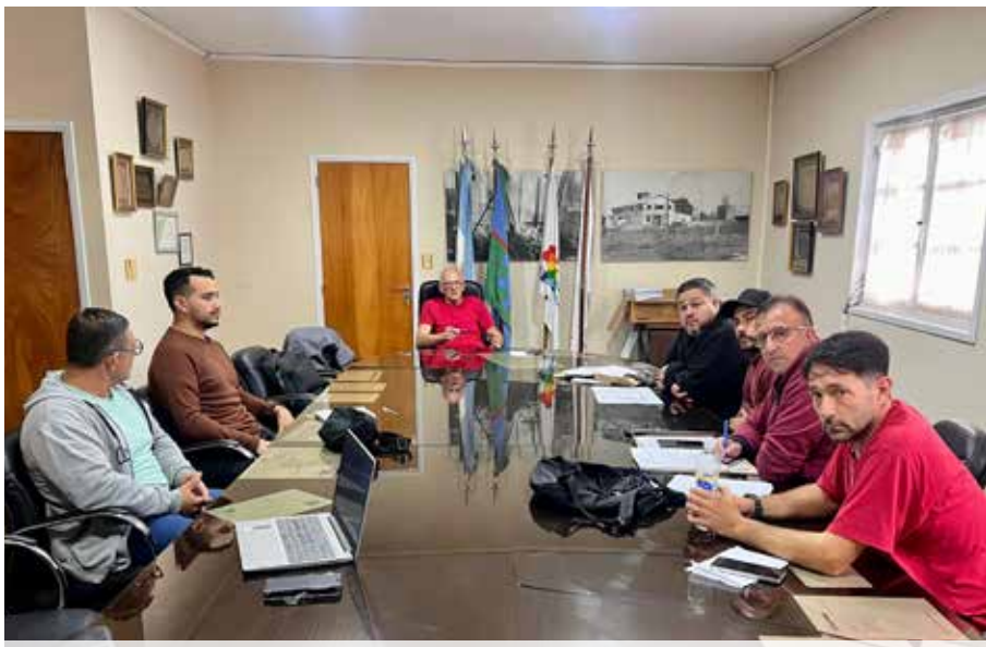
CLYFEMA - MAR DE AJÓ