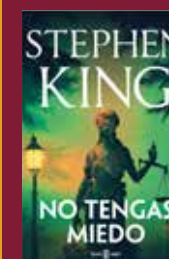
"No tengas miedo" Stephen King