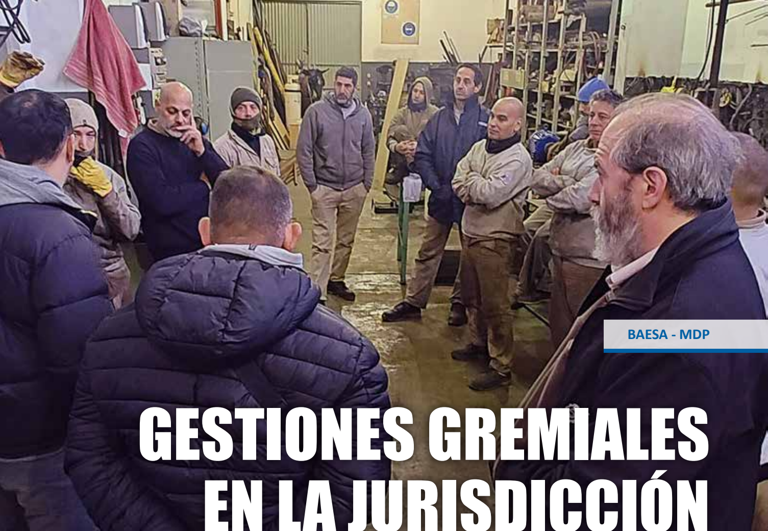
BAESA - MDP