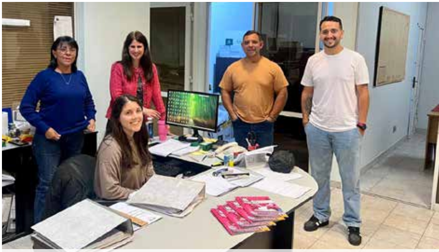
COOP. LAGUNA DE LOS PADRES