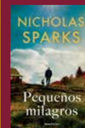
"Pequeños milagros" Nicholas Sparks