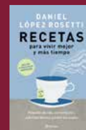
"Recetas" Daniel López Rosetti