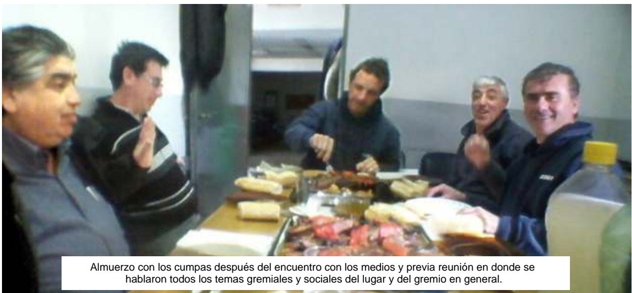
Almuerzo con los cumpas después del encuentro con los medios y previa reunión en donde se hablaron todos los temas gremiales y sociales del lugar y del gremio en general.