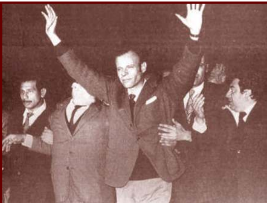
El compañero Agustín Tosco saluda a los trabajadores cordobeses, a poco de ser liberado del penal de Rawson.

Esa noche nadie durmió. El recuerdo de los mártires caídos, la imagen de cada uno, el heroico ejemplo de cada uno, llenaba la imaginación, hacía estremecer los sentimientos y daba una pauta más del duro y glorioso camino revolucionario que recorren la Clase Obrera y el Pueblo hasta su total y definitiva liberación."