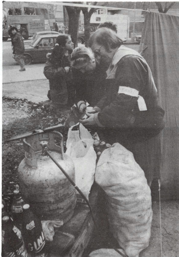
CARPA DE LA SOLIDARIDAD

¿Cuál es el fin que persiguen estos nuevos "cruzados"? Romper con todos los principios de nuestra