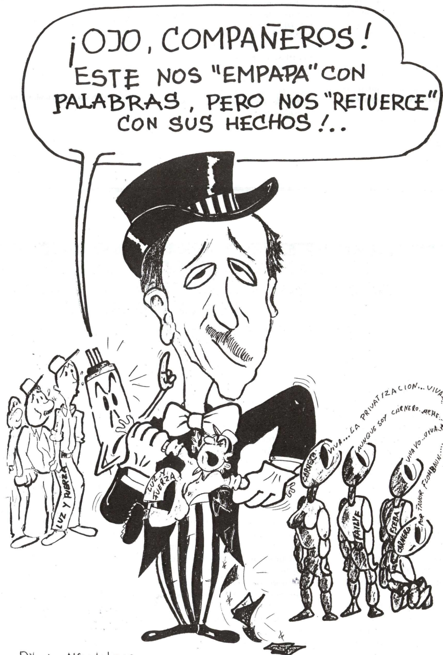
Dibujo: Alfredo Lago

TES Y PARA QUE TERMINE LA CORRUPCION EN LA EMPRESA, REUNIDOS EN LA CARPA SOLIDARIA, RODEADOS DEL CALOR DE LOS MARPLATENSES, mientras tanto en frente, se encontraba quien lanzara un saludo hipocrita, que no siente, que no le interesa el futuro de nuestros trabajadores... ¡CADA VEZ MAS SOLO!