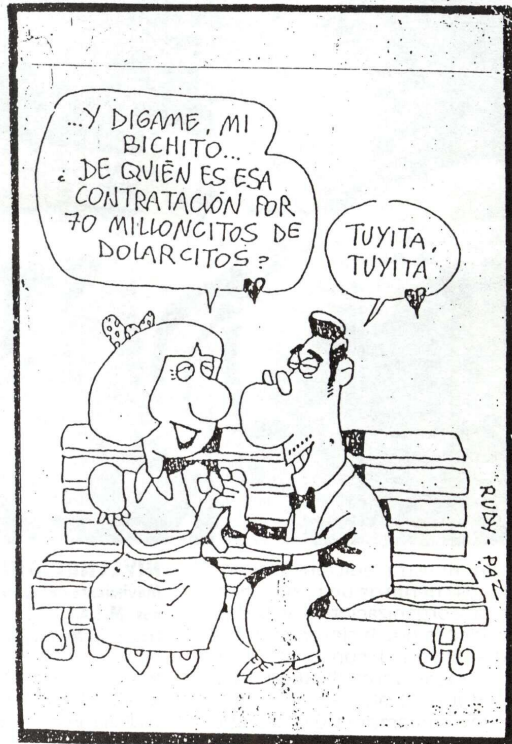
El humor de Rudy y Paz publicado por Página 12.