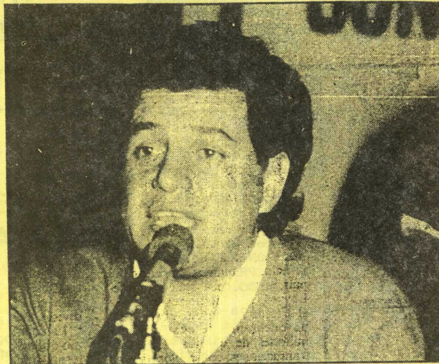
El Secretario General de la Asociación de Trabajadores del Estado (ATE), señaló la relación existente entre la política de privatizaciones y la deuda externa. Respondió, además, al slogan oficial sobre "eficiencia y modernización".

P.- ¿Cuál es su interpretación acerca de la privatización de empresas estatales que impulsa el gobierno?