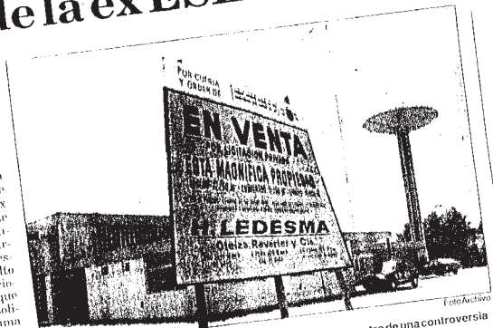
Las instalaciones de la ex ESEBA en J.B. Justo y México, epicentro de una controversia judicial.