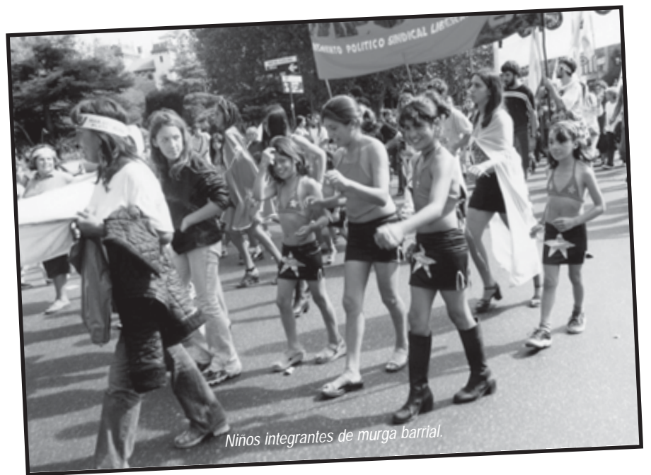
Niños integrantes de murga barrial.