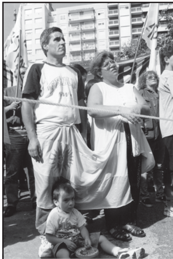
La familia participó de la Marcha Grande. Final con Acto público.

No se sostiene que las grandes mayorías del mundo queden fuera del sistema. Nunca en la historia de la humanidad la ambición de los poderosos apostó tan fuerte.