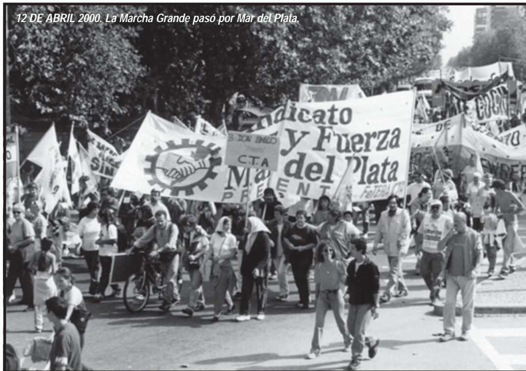
12 DE ABRIL 2000. La Marcha Grande pasó por Mar del Plata.