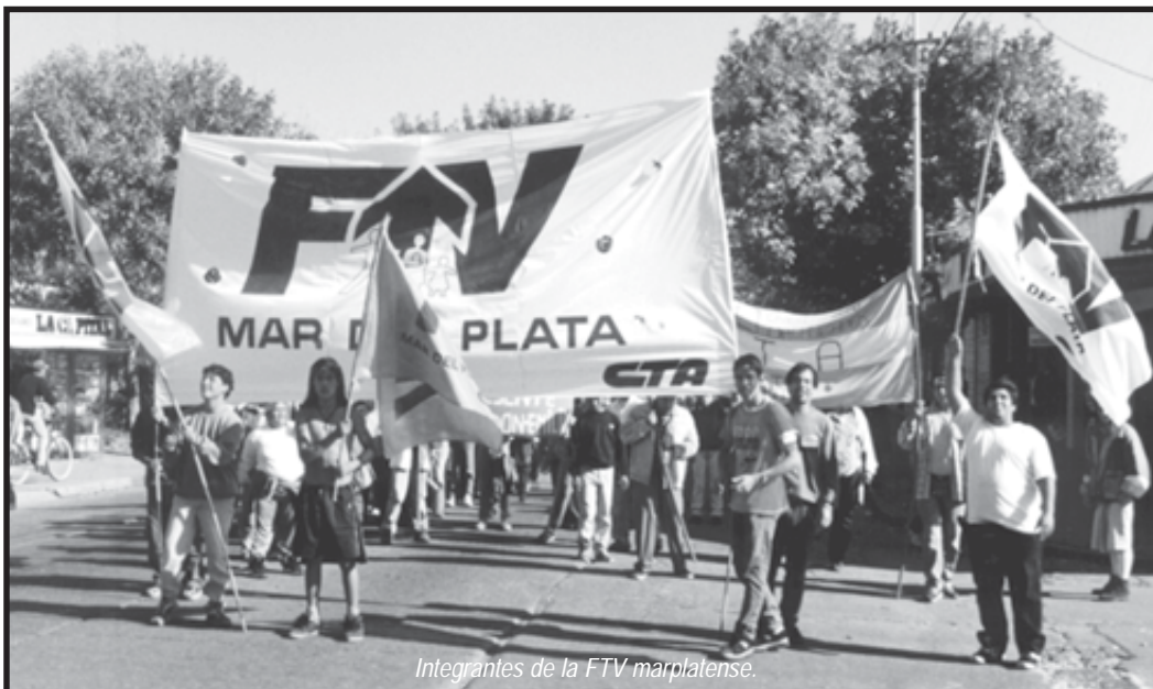
Integrantes de la FTV marplatense.