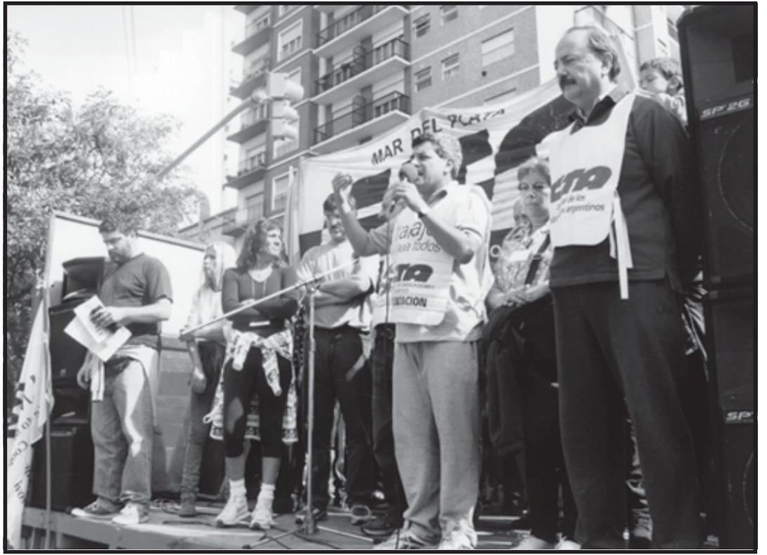
El Secretario General de la CTA nacional, Víctor de Gennaro, dirige la palabra a los manifestantes.