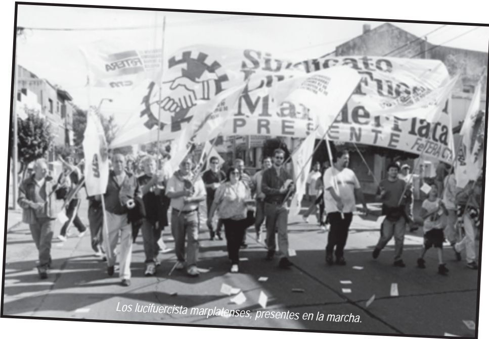
Los lucifuercista marplatenses, presentes en la marcha.

La Consulta puede ser una realidad en la ciudad.