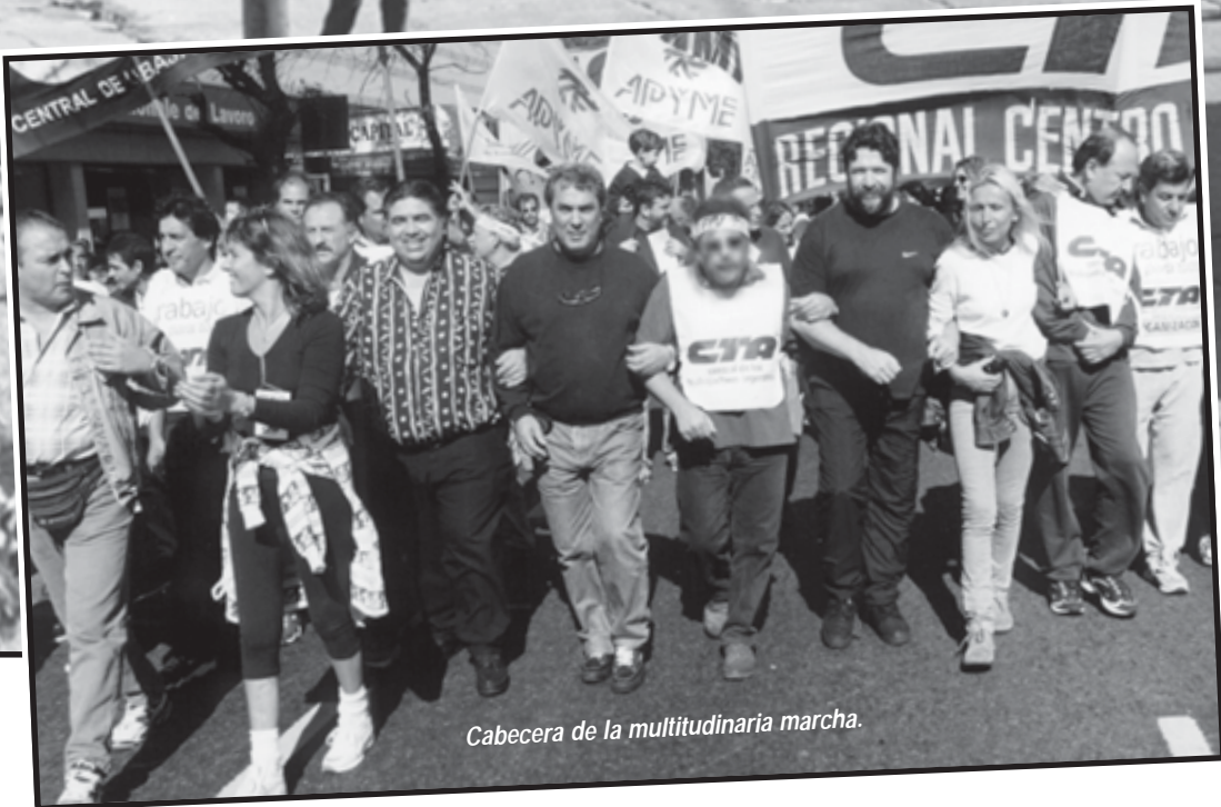
Cabecera de la multitudinaria marcha.