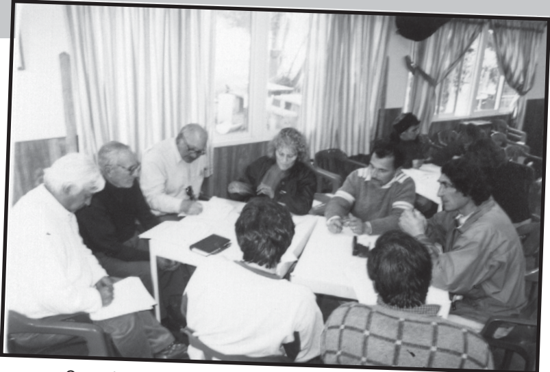
Otra delegación de Cusabb de Bahía Blanca. Ambas comisiones apoyaron la tarea de los capacitadores.