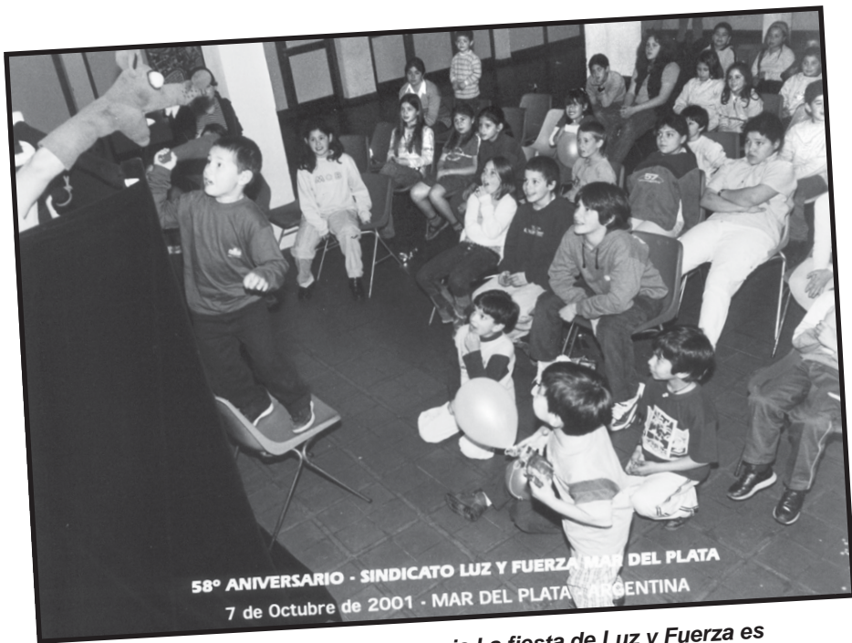
58° ANIVERSARIO - SINDICATO LUZ Y FUERZA MAR DEL PLATA 7 de Octubre de 2001 - MAR DEL PLATA - ARGENTINA