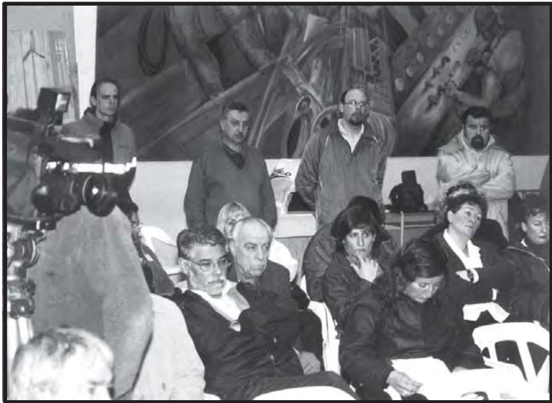
Durante el conflicto, el salón de actos se llenó varias veces. La comunidad y los medios de comunicación dieron amplio apoyo al reclamo de los trabajadores lucifuercistas.

blea decreta medidas de acción directa: Paro Técnico y Administrativo para el día lunes 1 de octubre.