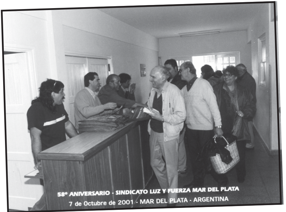
58° ANIVERSARIO - SINDICATO LUZ Y FUERZA MAR DEL PLATA 7 de Octubre de 2001 - MAR DEL PLATA - ARGENTINA