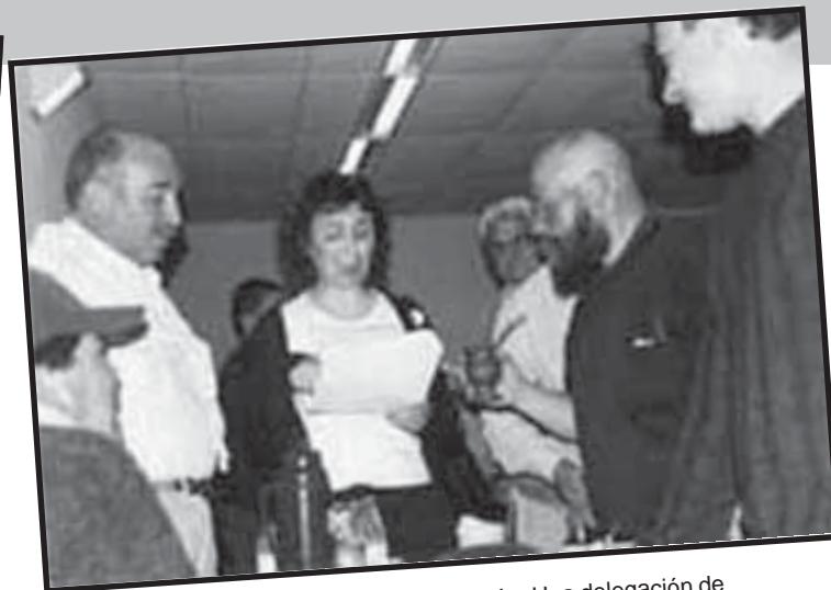
Parte de los trabajos en Comisión. Una delegación de Atahualpa de Mar del Plata.