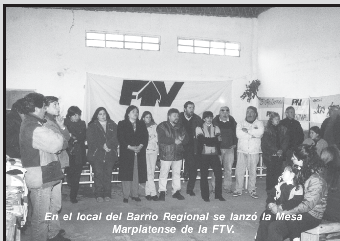
En el local del Barrio Regional se lanzó la Mesa Marplatense de la FTV.