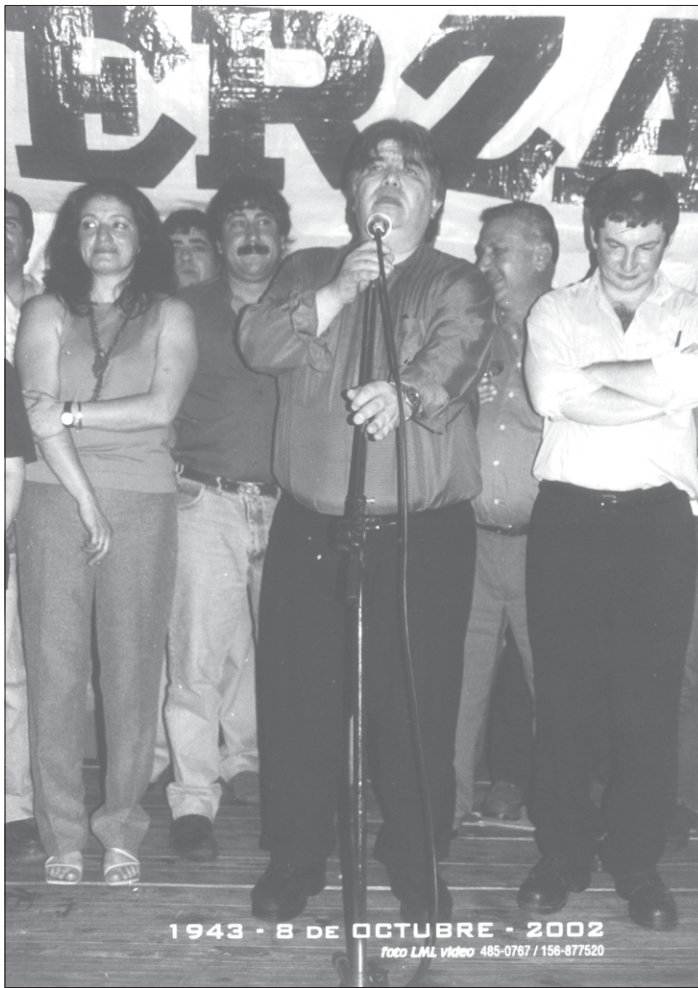
LULA PRESENTE. Rigane en su discurso tuvo presente las elecciones en Brasil. El orgullo de un dirigente sindical por que un trabajador llega a la presidencia del país más grande de América Latina.