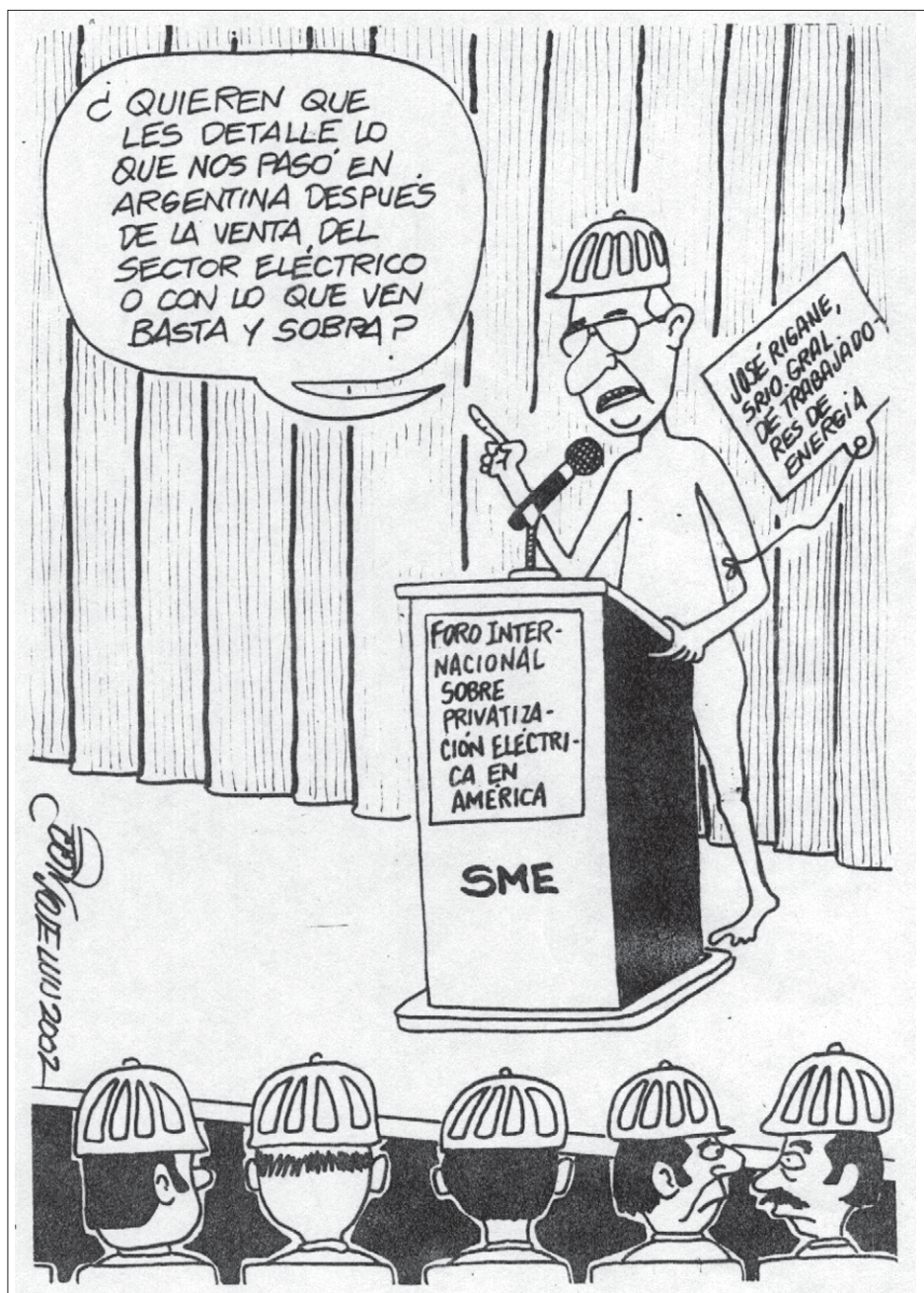
Publicado en EXCELSIOR, diario nacional mexicano, el 24 de octubre de 2002, página 8.

Desprivatizar es mejor que privar. Es más bueno, estimula y sienta mejor.