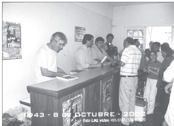
INGRESO CON DONACIONES. Los compañeros/as acompañaron la entrada con el aporte de un alimento no perecedero. (Ver nota sobre Mar de Ajó y de entrega de alimentos a la FTV.)

Por lo tanto, cros. y cras. esto lo hacemos entre todos, pero necesitamos superar exclusivamente la cuestión sectorial, necesitamos involucrarnos en la construcción de la fuerza del movimiento obrero que sea capaz, con otras fuerzas, de poder dar fin a esta alternativa, de esta crisis social y económica de Argentina, de representación política, (que) no se resuelve con una candidatura, no se resuelve con un candidato, compañeros, hace falta mucho más que eso, hace falta un proyecto, hace falta un espacio, hace falta (determinar) cómo lo hacemos, para qué lo hacemos y con quién lo hacemos; ¡y para eso, necesitamos no sólo abrir la mente, no sólo ser creativos, necesitamos abrir el corazón compañeros y no mirar al de al lado con desconfianza, mirarlo con afecto y sumarnos porque todos vamos a poder cambiar esta realidad que nos agobia!.. (aplausos)