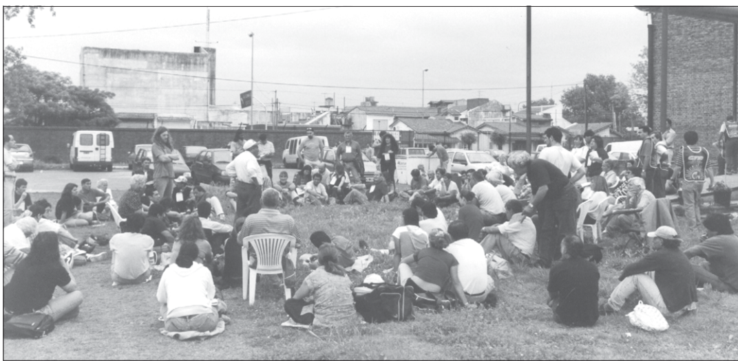
Participación y protagonismo. En Lanús se discutió en comisiones multitudinarias.

Allí se vieron cómo cada trabajador y cada organización apeló a sus raíces, a sus colores. Pecheras verdes, blancas, azules. Delegados y delegadas de 93 distritos de la provincia, incluidos el conurbano y las principales ciudades del interior, llegaron a Lanús el viernes para participar de este encuentro representando a los distintos sectores que conforman la CTA: estatales, docentes, judiciales, organizaciones de desocupados, trabajadores aeronáuticos, gastronómicos, de refineras de maíz, periodistas, telefónicos, bancarios, docentes universitarios, jubilados, trabajadores