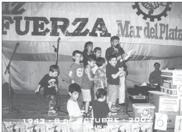
A LOS PREMIOS. Los pibes luciferucistas ayudaron a la hora del sorteo. Esta vez los premios provinieron de donaciones de distintos sectores..