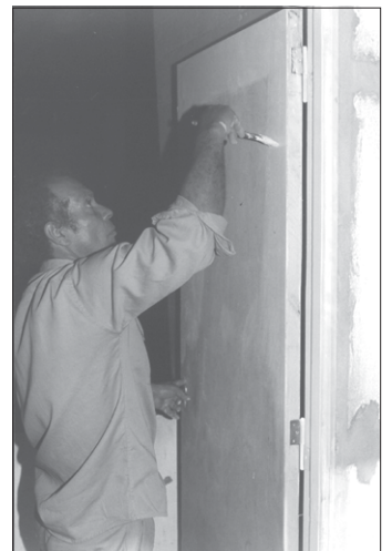
MANTENIMIENTO. Se culminó con la pintura del Centro Cultural y además se avanzó sobre el Centro de Jubilados. Le tocó a la azotea y a los baños.