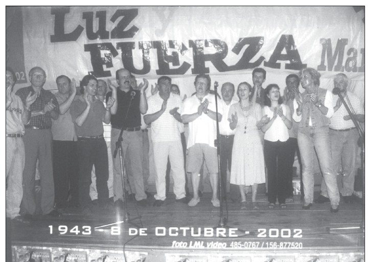
DELEGADOS. El Cuerpo General de Delegados subió al escenario. La unidad en la diversidad. La convivencia política que se pregona hacia afuera, se vive hacia adentro: todos los días y en la fiesta también.