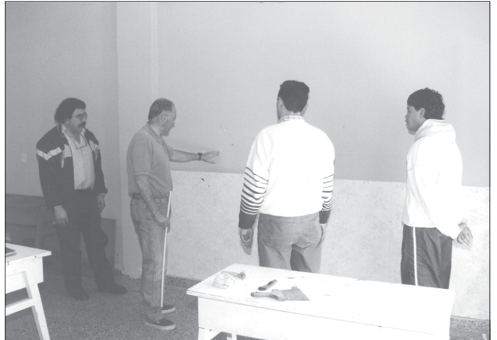
CURSO DE EMPAPELADO DECORATIVO. Un interesante curso con aptitud laboral se está desarrollando en nuestro Centro Cultural. Por un precio módico, los afiliados y amigos pueden acceder al manejo de un oficio interesante. La capacitación incluye preparación de superficies, patologías, aplicación de papeles vinílicos, vinilizados, gofrados, guardas decorativas, papel base, combinación de diseños.