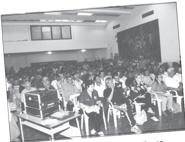
La FeTERA, junto a la FETIA, realizaron el jueves 12 el Primer Plenario Nacional del sector.

Algunos creyeron ver en el mismo la exigencia de Luis D'Elía, conductor de la FTV, de que en