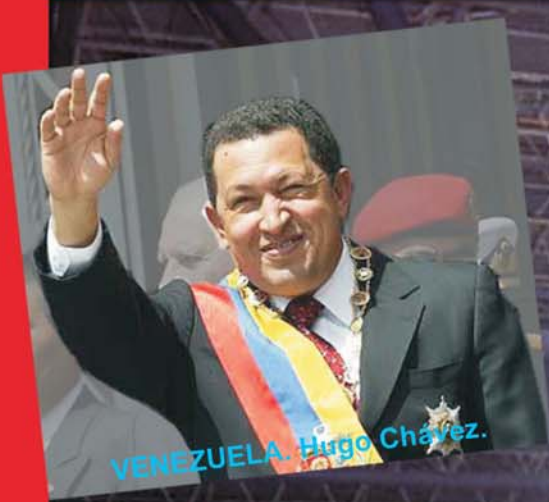
VENEZUELA. Hugo Chávez.