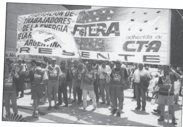
Presencia de los compañeros de la FeTERA, encolumnados para marchar a las deliberaciones del VI Congreso.