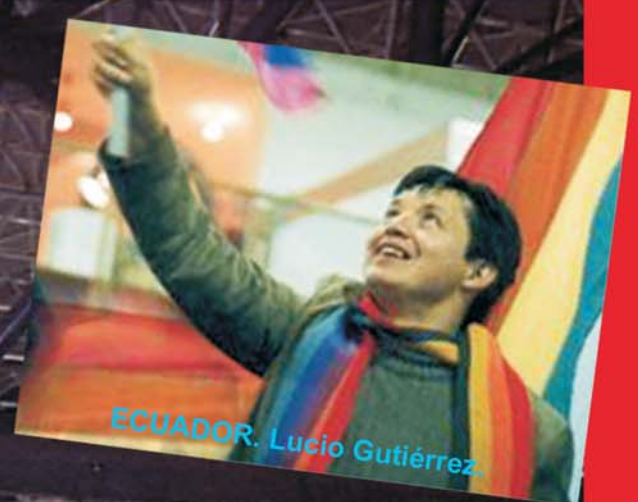
ECUADOR. Lucio Gutiérrez.