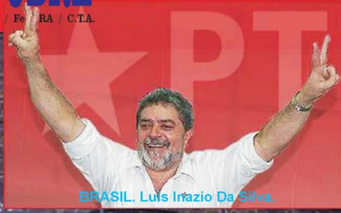
BRASIL. Luis Inácio Da Silva.