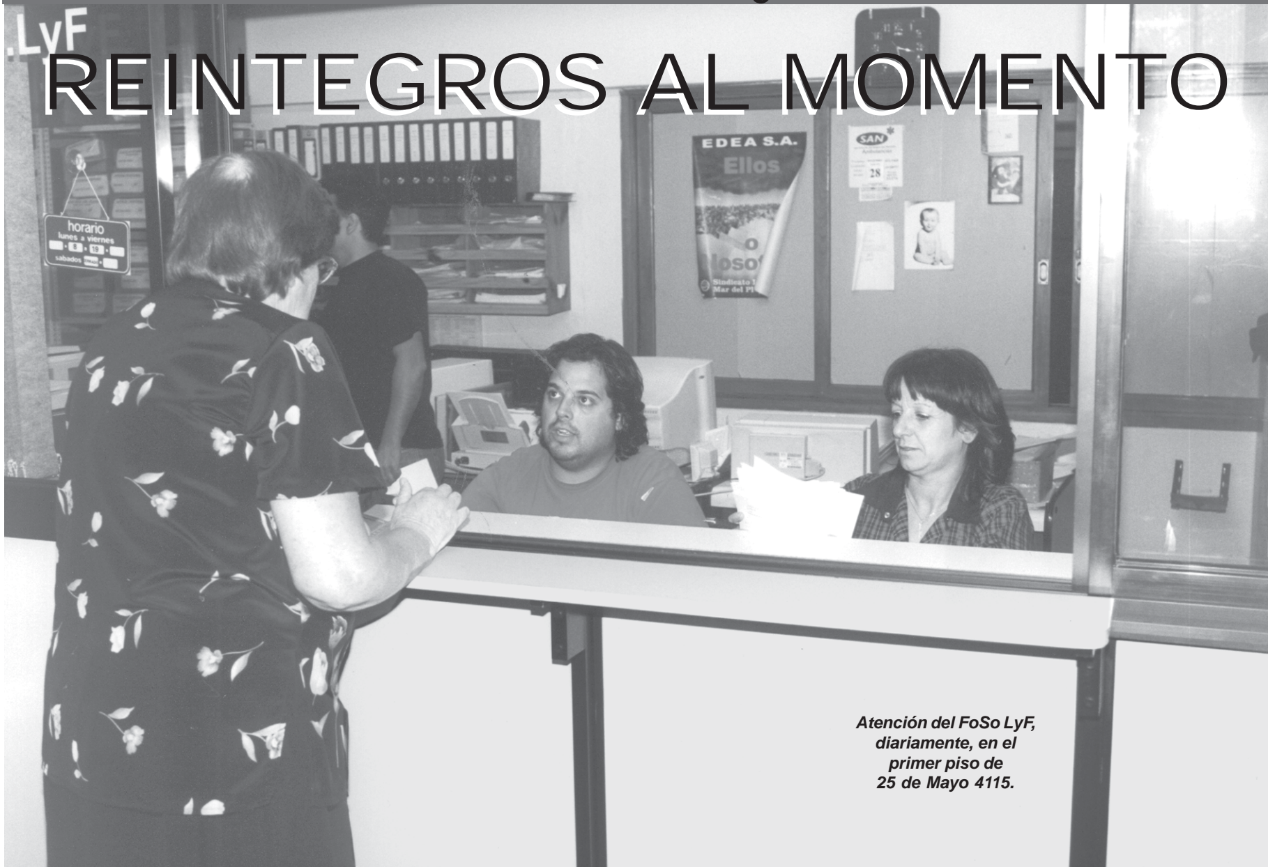
Atención del FoSo LyF, diariamente, en el primer piso de 25 de Mayo 4115.