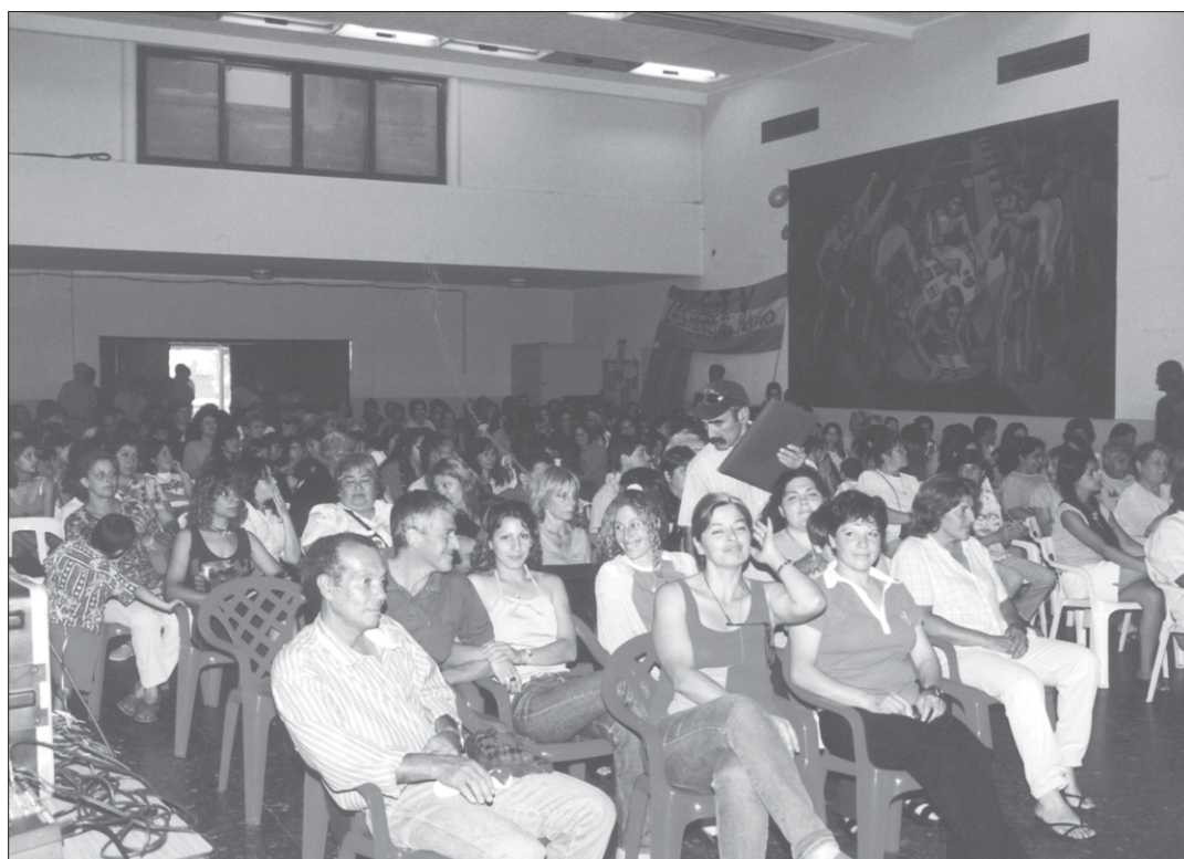
El salón de actos colmado por los integrantes de la FTV en el encuentro de fin de año. Los compañeros/as tuvieron su momento de reconocimiento para Luz y Fuerza Mar del Plata.