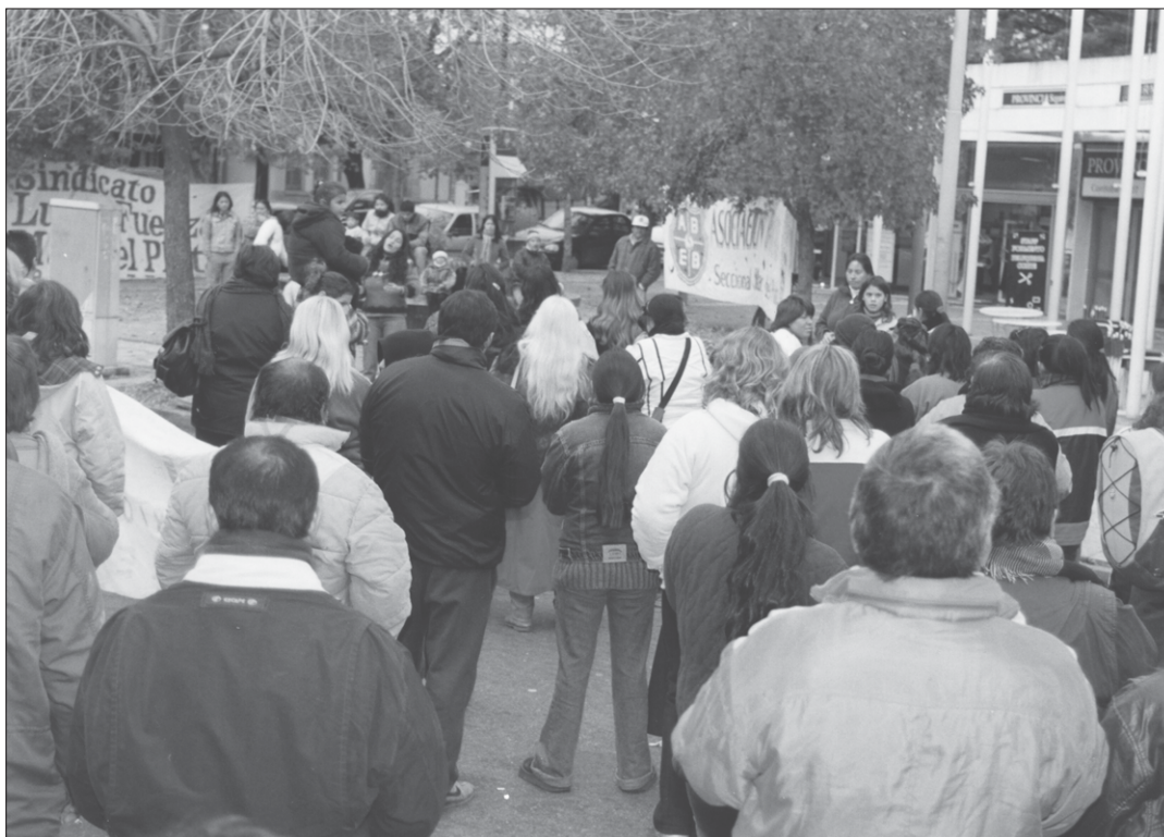
MAR DEL PLATA. "Garrafazo" popular ante la sede de la empresa Camuzzi Gas Pampeana.

lo, con lo cual, hasta podría regalarse.