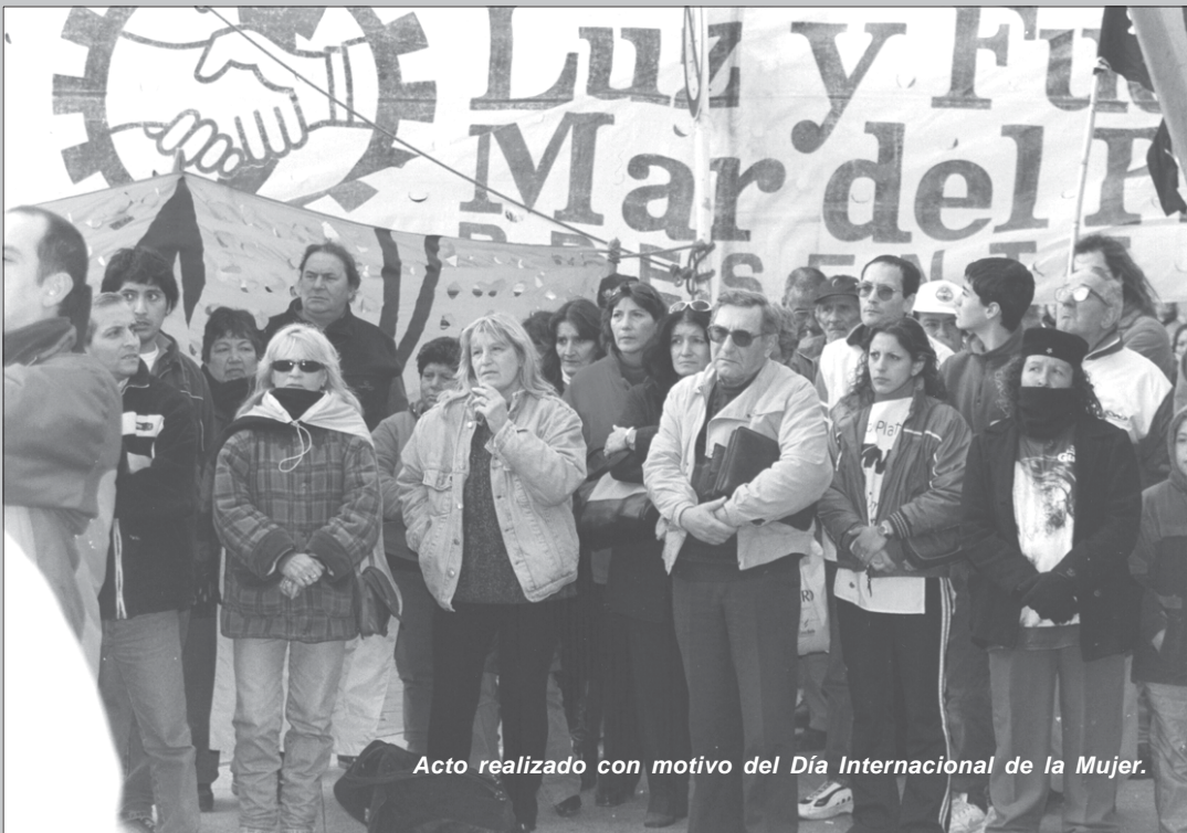
Acto realizado con motivo del Día Internacional de la Mujer.

Hasta que ellas mismas escribieron la palabra Compañera en todas las espaldas y en los muros de todos los hoteles porque las mujeres de mi generación nos marcaron con el fuego indeleble de sus uñas la verdad universal de sus derechos. (...)