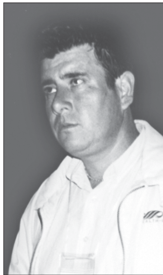
Compañero Secretario general del gremio de la Construcción (PIT-CNT) de Uruguay.

Es vital. La pérdida de los recursos no renovables llevó a la Argentina a un descalabro económico y social sin precedentes. En el Uruguay se dio una batalla muy grande. Primero, en el año 92 diciéndole, con un 72 por ciento del pueblo, no a las privatizaciones. Y la última gran manifestación fue el 7 de diciembre pasado, cuando dijimos que el agua era vida y el