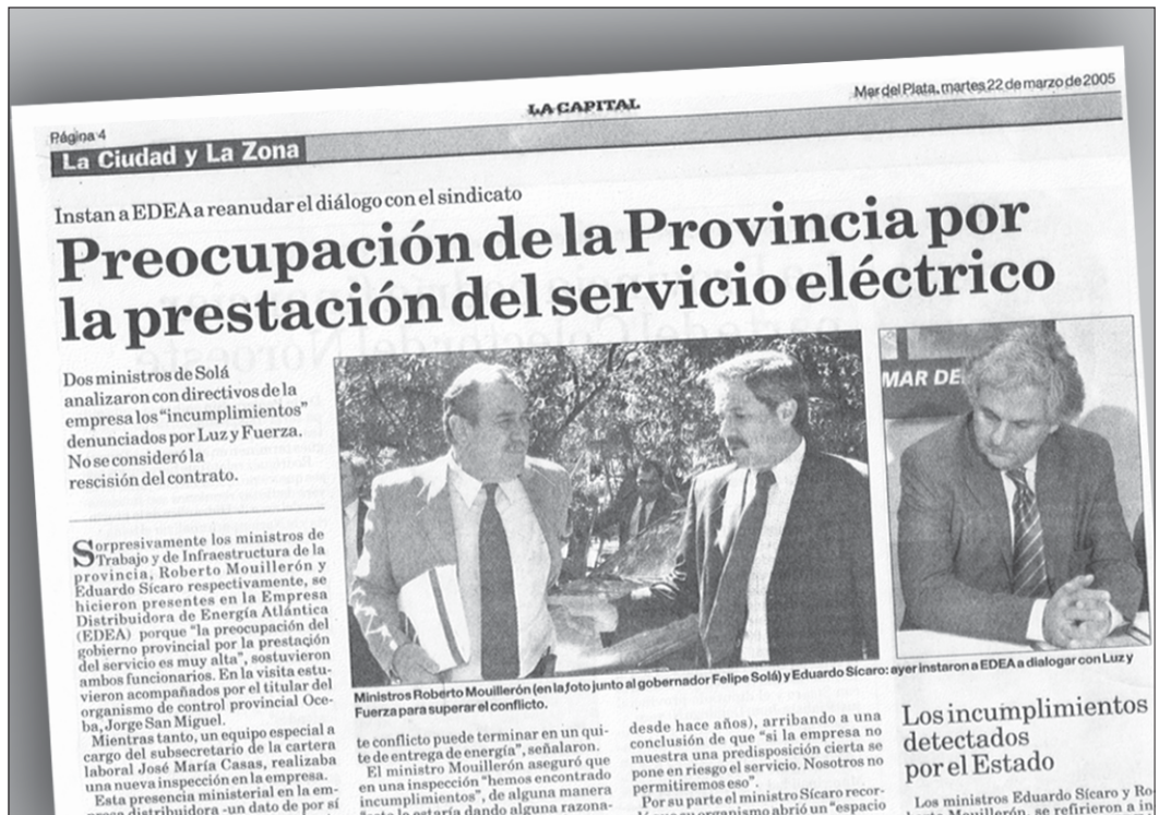
Diario "La Capital" de Mar del Plata, 22 de marzo de 2005.-

muy clara de no perder rentabilidad. Seguramente, este encuentro con Felipe Solá y la presencia en Mar del Plata de los ministros fueron el detonador para el triunfo conseguido en esta etapa de una lucha que seguiremos dando. ■