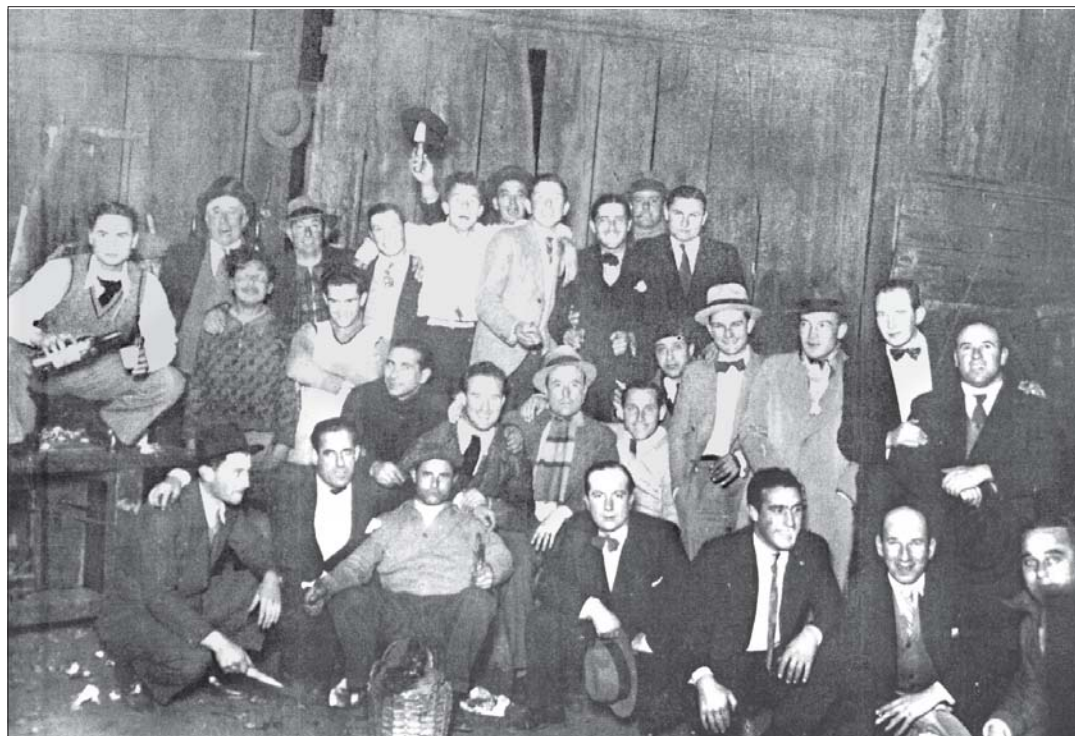
Los fundadores de nuestro gremio en un instante eternizado de la historia de Luz y Fuerza.