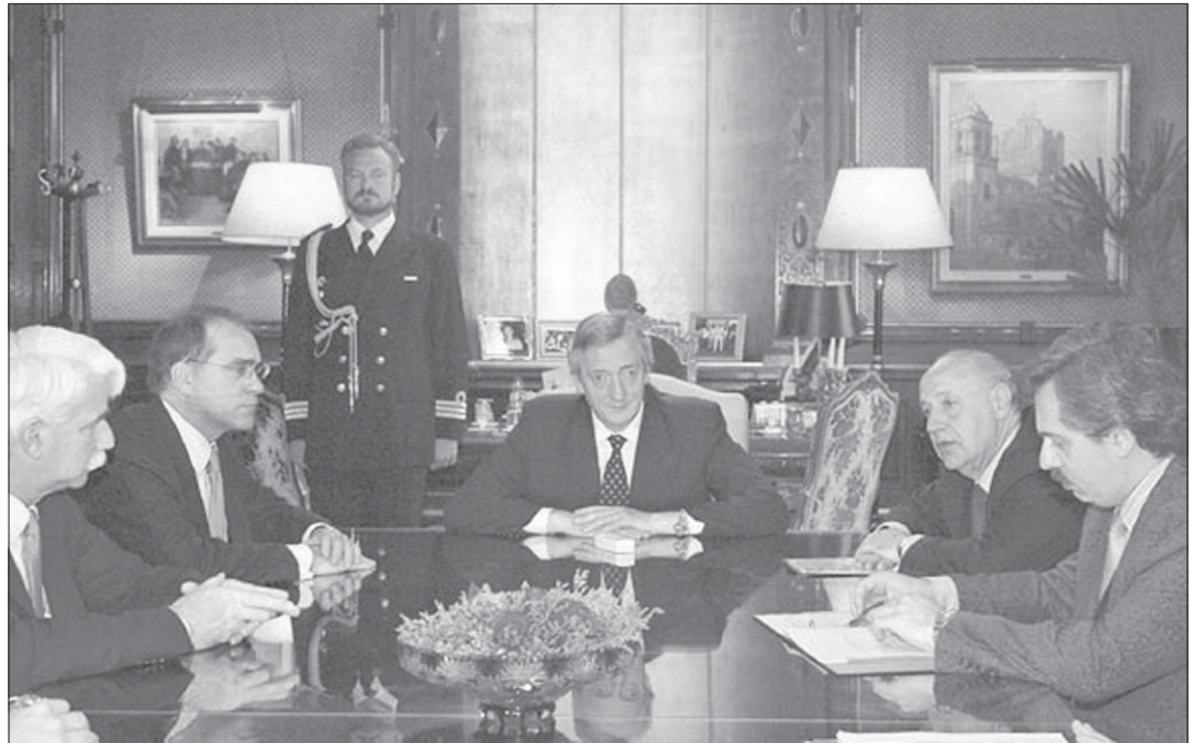
Tiempos de buenos negocios. Reunión del presidente Néstor Kirchner con los banqueros de las AFJP. Nada perturbará sus privilegios.

En el futuro inmediato otro dilema asoma. En octubre se vuelve al aporte personal del 11 por ciento del salario, luego de la decisión de Domingo Cavallo, en tiempos de la Alianza, de reducirlo al 7 por ciento para mejorar los salarios. Una mentira boba que ni mejoró los salarios y contribuyó a quitarle fondos de su futura jubilación a los trabajadores. Para tener una idea de lo pequeño que quedó el aporte personal al sistema de AFJP en Argentina vale la comparación internacional: en Uruguay es del 15 por ciento del sueldo; en Colombia, 13,5 por ciento; en Chile 12,4 por ciento; y en México 11,5 por ciento. Pero el grave problema que se presenta es que, con la discusión del salario durmiendo la siesta eterna, la vuelta al aporte del 11 por ciento va a sig-