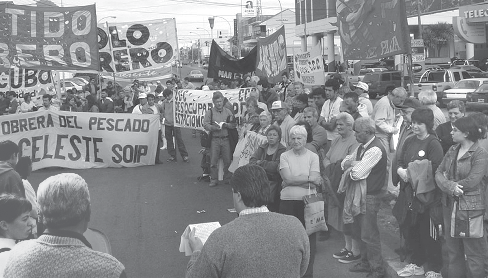
Un aspecto de la concurrencia al acto. Los presentes consideraron que a pesar del frío de la jornada es indispensable reivindicar este derecho fundamental del hombre.

Se conmemoró un nuevo 1 de Mayo. En Mar del Plata, el lugar elegido fue el Puerto. No existe un lugar en Mar del Plata tan fuertemente identificado con el trabajo, como éste. Por eso las políticas de los noventa apuntaron a su corazón. Hoy, a pesar de las heridas no cicatrizadas y las cuentas pendientes, el trabajador marplatense eligió ese lugar. Será que allí, desde esa adversidad que no se revierte, se empezará a dar vuelta la tortilla.