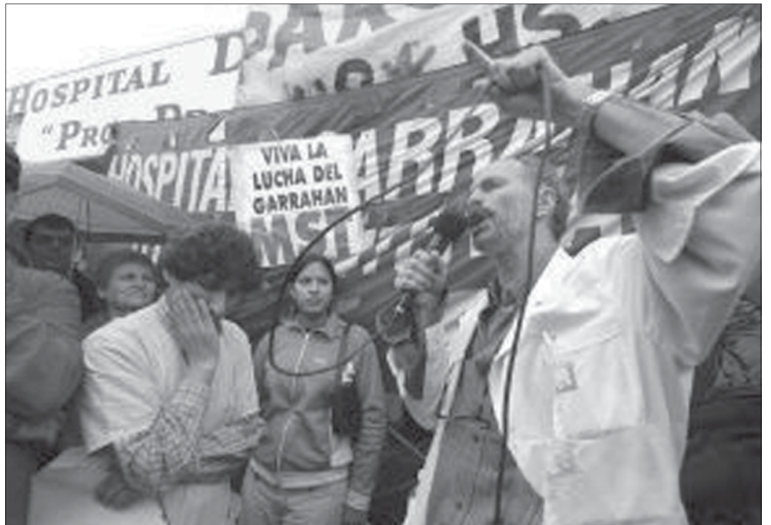
La lucha de los trabajadores del Hospital Garrahan sintetizó el reclamo de recomposición salarial de los trabajadores estatales por siempre postergados.

saber ver, en la era actual, las luchas en Bolivia, de todos los sectores populares en la misma dirección de recuperación de patrimonio nacional, el no dejarse saquear más; bueno, lo de Ecuador en plena crisis, lo de Brasil, con un trabajador de presidente, donde no todo se reduce a esa valoración pero muchas veces se diluye en la discusión de lo que supuestamente, se hace bien o mal; la histórica e inigualable Cuba; el Uruguay de Tabaré Vázquez mostrando que la construcción es un proceso -no un acto- y por eso el frente amplio llega después de 30 años de construcción al gobierno nacional y dispuesto a implementar las mejores políticas para los suyos; y en ese contexto sin dejar de mencionar el resto del mundo, estamos nosotros con la necesidad imperiosa de jugar un rol protagónico en la integración de los pueblos a nivel regional y para eso necesitamos salir del infierno neoliberal, el que nos impusieron. Y de eso hay cada vez mayor compresión, allí está una de las claves de por qué el modelo perdió consenso, aunque todavía tiene poder, pero ya no puede engañar más. Entonces se va perdiendo el miedo y aparece el ánimo de decidirse a pelear por lo propio, pero ¡cuidado! Pensemos que a los trabajadores siempre nos quieren borrar el pasado, nuestra historia de lucha, como que todo empieza ahora, hoy . Pero volviendo a la pregunta: