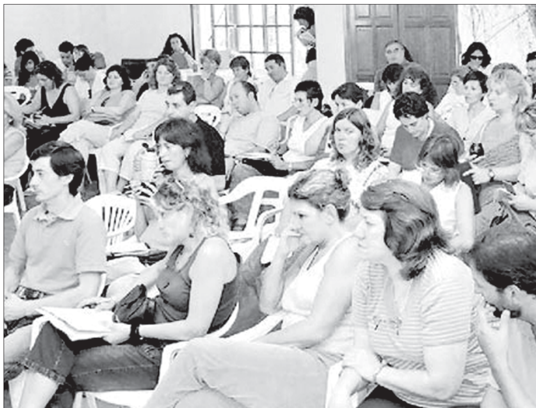
Docentes de Entre Ríos se sumaron a los de Jujuy, Córdoba y Formosa en el reclamo de aumentos salariales.