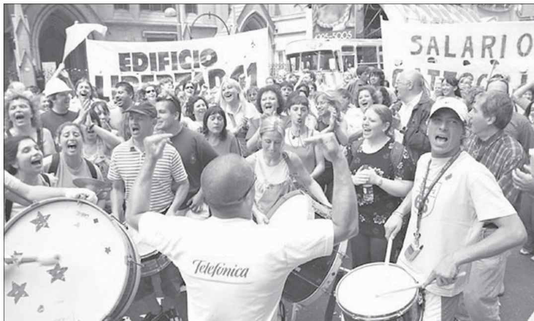
Los trabajadores telefónicos de la Capital sostuvieron un conflicto inédito con metodologías diversas (piquetes, escraches, tomas de edificios) enfrentando a dos de las tres empresas más grandes del país: las telefónicas privatizadas.

multinacionales y la UIA”, Lavagna, quien no sólo nos faltó el respeto a todos los sectores populares, sino que, además, provocó mucha indignación con la afirmación de que los aumentos