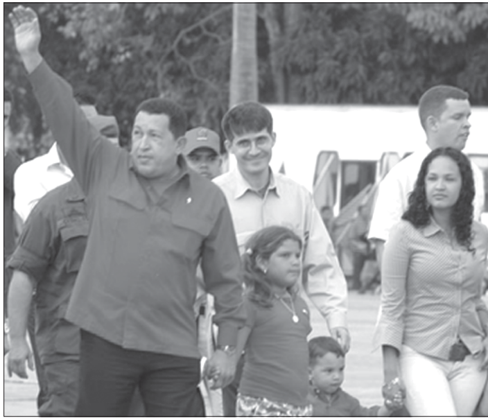
Presencia del presidente de Venezuela, Hugo Chaves, con su esposa e hijos.

"Volvemos a nuestros países a incrementar las luchas de la juventud y los estudiantes", dijo en la sesión final el portugués Miguel Madeira, presidente de la federación organizadora, antes de ratificar la declara-