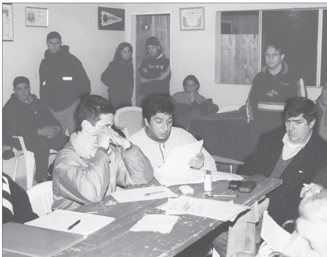
Compañeros de Comisión Directiva y del Cuerpo General de Delegados, durante la Asamblea realizada el viernes 9 de septiembre.

Durante una asamblea llevada a cabo el viernes 5 de agosto en Mar de Ajó, en la que se decidió la realización de un paro de 2 horas, también se resolvió presentar al Ministerio de Trabajo una serie de denuncias del gremio ante incumplimientos de la Cooperativa. Ésta realizó su descargo con argumentos poco serios y -en algunos casos- falaces.