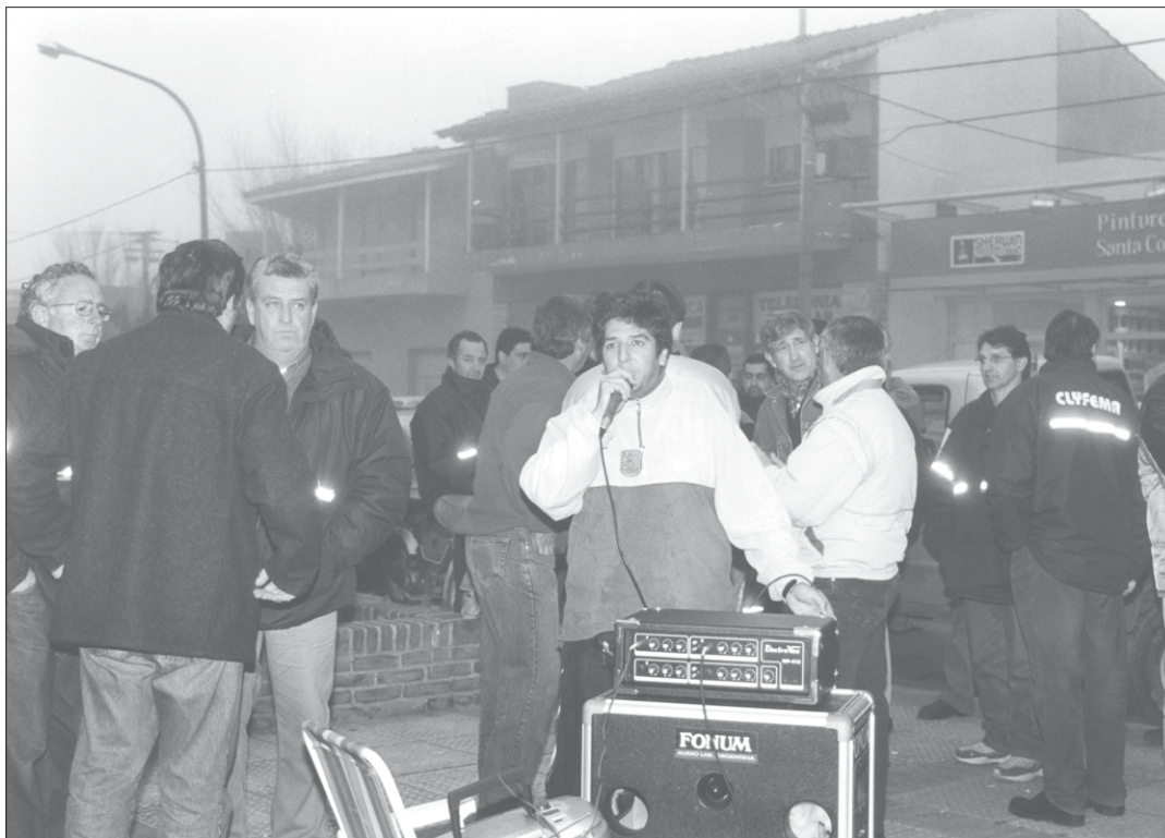
Radio abierta. A pesar de las inclemencias del tiempo, los compañeros de Mar de Ajó, los integrantes del Cuerpo General de Delegados y de Comisión Directiva denunciaron las irregularidades de CLYFEMA.

La cooperativa reiteró la actuación conforme a derecho, y solicitó que tome intervención la