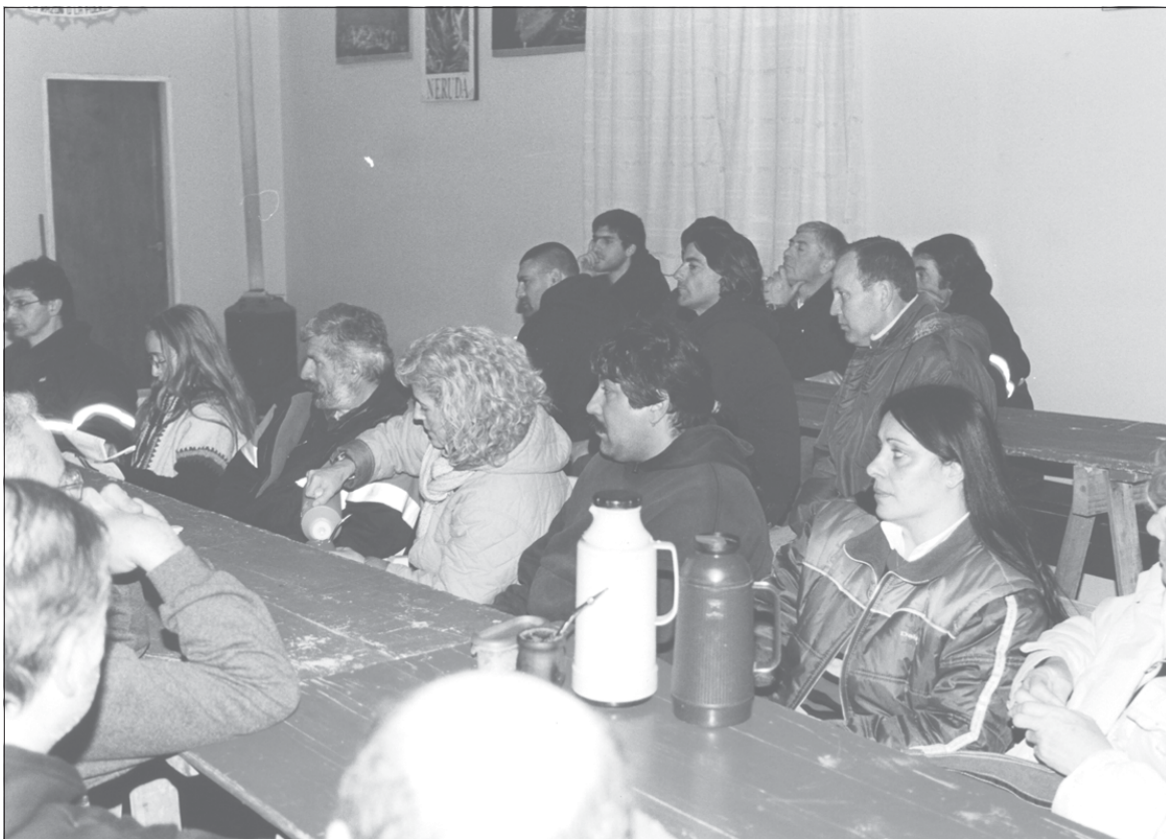
Otro momento de la Asamblea realizada el viernes 9 de septiembre en Mar de Ajó.