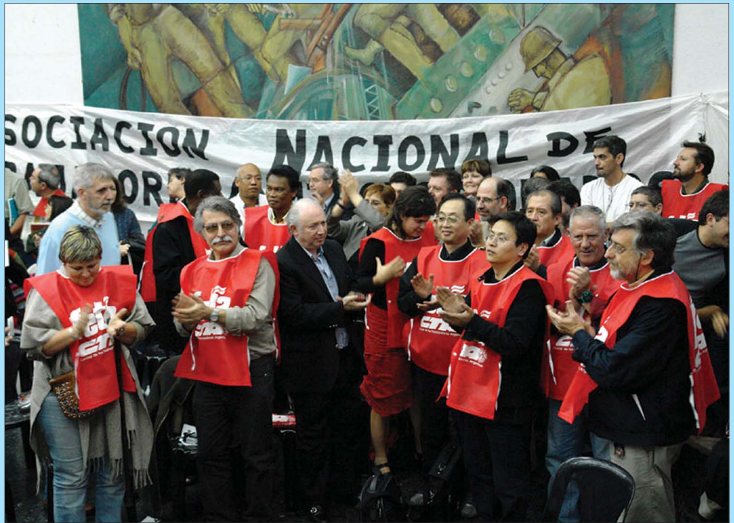
En este Encuentro de los Trabajadores de diversos sectores productivos y de servicios vitales, estuvo presente la solidaridad internacional, con delegados de más de 30 países de todo el mundo.

Con la participación de 260 delegados congresales de todos los sectores laborales y del territorio provincial, en esa provincia se trabajó para transformar el congreso en "una gran asamblea de los trabajadores donde todo se debate y se define de