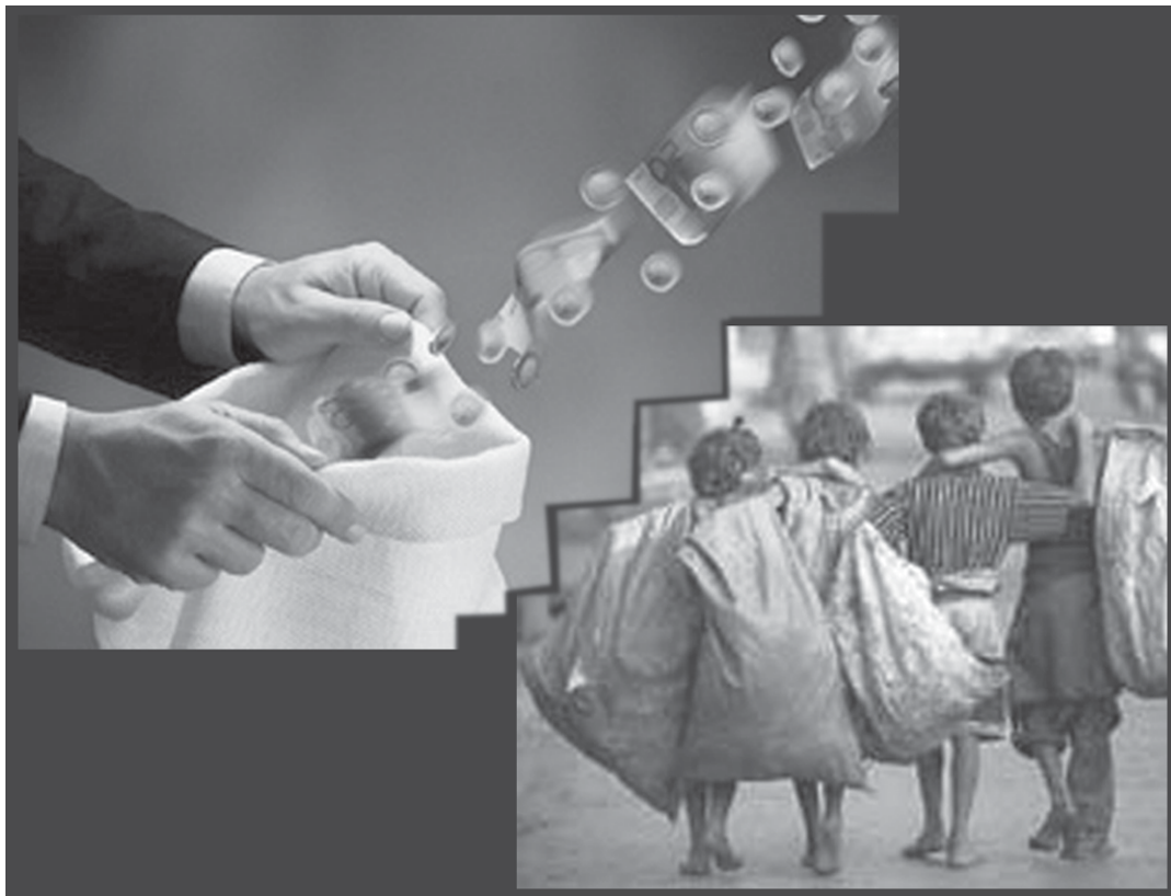
Desigualdad en la distribución. Mientras algunas pocas bolsas concentran las riquezas, otras muchas juntan sólo miserias.

del 30 por ciento en el 2005 y Telefónica de un 40 -por poner sólo dos ejemplos- los salarios no terminan de alcanzar la canasta básica para sobrevivir. En síntesis, en un contexto de reanimación de actividad económica, la distribución se hace más regresiva aún. Los beneficiarios siguen siendo los mismos de los 90. La caída desigual del poder adquisitivo de los asalariados y la pérdida aún mayor de aquéllos que dependen de los planes laborales que permanecen casi sin ajuste (se les elevó en no más de 50 pesos el ingreso con el cambio de plan), o que no tienen ingreso alguno, son evidencias notorias al respecto.