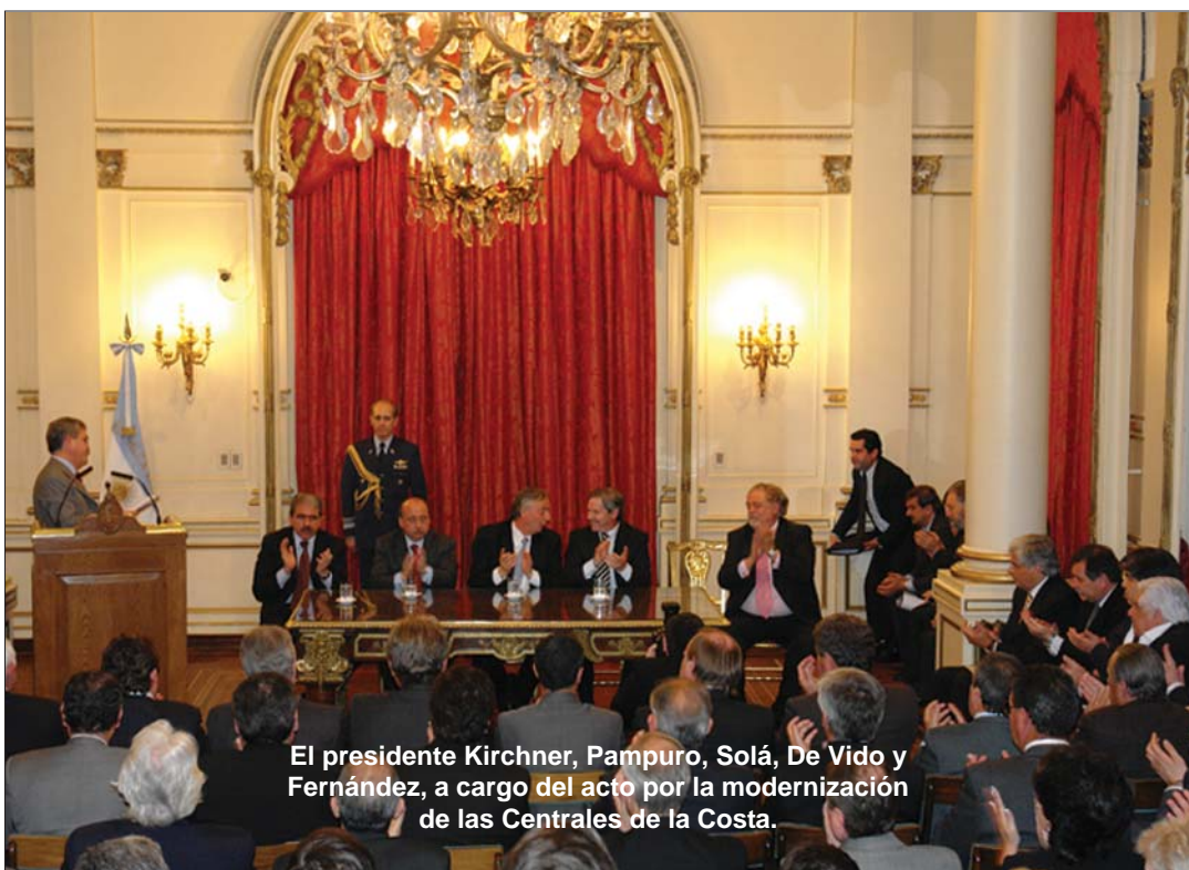
El presidente Kirchner, Pampuro, Solá, De Vido y Fernández, a cargo del acto por la modernización de las Centrales de la Costa.