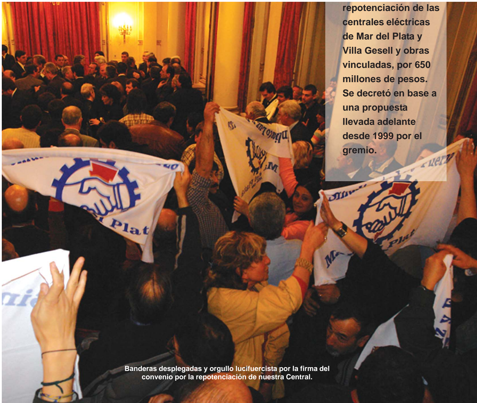
Banderas desplegadas y orgullo lucifuercista por la firma del convenio por la repotenciación de nuestra Central.

El martes 3 de septiembre trabajadores de la Central 9 de Julio viajaron con el Sindicato Luz y Fuerza Mar del Plata a la Casa de Gobierno, donde participamos del acto por la firma del convenio por la repotenciación de las centrales eléctricas de Mar del Plata y Villa Gesell y obras vinculadas, por 650 millones de pesos. Se decretó en base a una propuesta llevada adelante desde 1999 por el gremio.