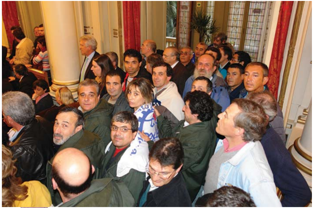
La nueva generación de trabajadores de la Central 9 de Julio colmó el recinto de la Casa de Gobierno.