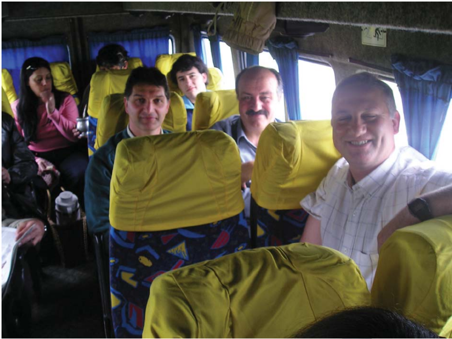
Mate va, mate viene, entre anécdotas, siestas y entusiasmo, transcurrió el viaje en micro a la Capital Federal.