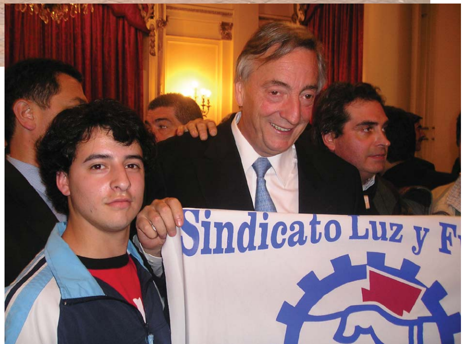
Hasta hijos de trabajadores nos acompañaron en la firma de tan importante acuerdo y aprovecharon para sacarse fotos con el presidente.