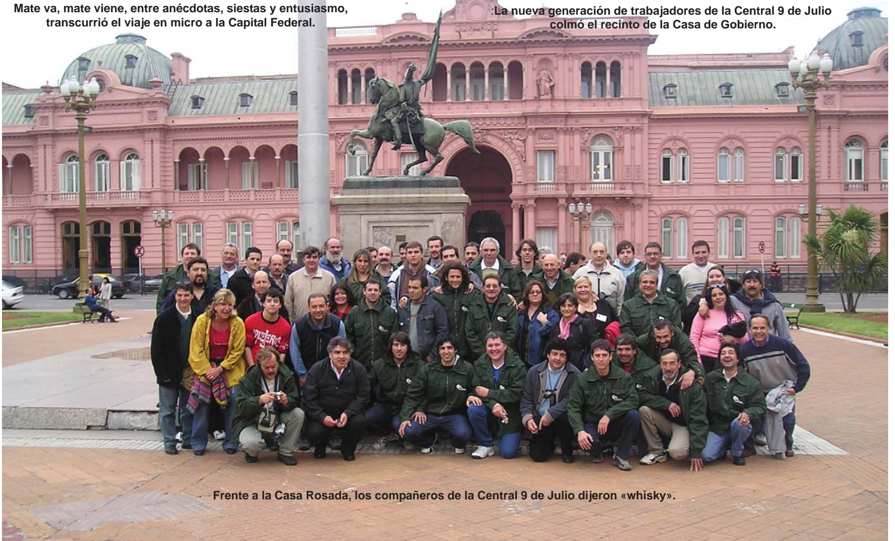
Frente a la Casa Rosada, los compañeros de la Central 9 de Julio dijeron «whisky».