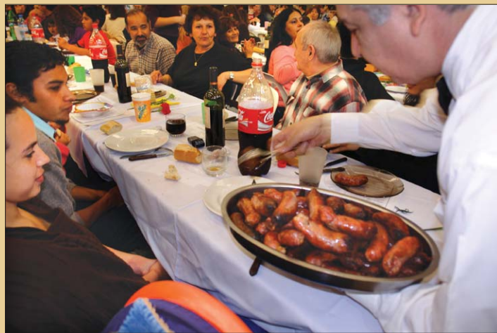
Luego del himno nacional y la marcha luciferista, la comida no se hizo esperar.

Los festejos terminaron cerca de las 19, momento en que los trabajadores y sus familias emprendieron el regreso a casa, luego de una jornadas de risas, anécdotas, baile, regalos y emoción.