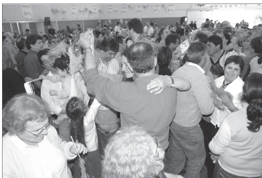
Todos bailamos Carnaval Carioca y compartimos el simpático cotillón.