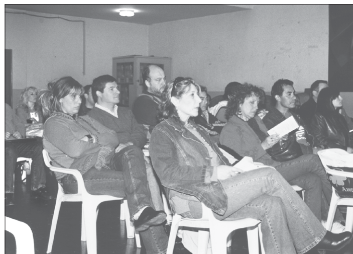
Vista de los participantes en el encuentro.

Para el psicólogo español Iñaki Piñuel y Zabala, otro de los pioneros en el estudio del flagelo, el acoso psicológico en el trabajo supone la más grave amenaza para la salud laboral