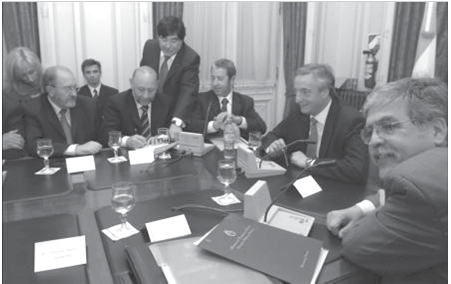
26 de octubre de 2006 en Casa Rosada. El presidente Néstor Kirchner con gobernadores. Firma del traspaso de hidrocarburos a las provincias productoras.

La campaña mediática iniciada hace algunos días en medios nacionales y reproducida en otros de Mar del Plata, apunta a desalentar nuevamente la posibilidad, en las puertas de una nueva temporada veraniega, de una emergencia energética. Esto ocurre, extrañamente, algún tiempo después de que, con sus propios intereses, fogoneados por esos mismos medios, el propio gobierno nacional, desde las declaraciones de algunos funcionarios, haya salido a alertar sobre posibles inconvenientes para garantizar el servicio en función de la demanda.