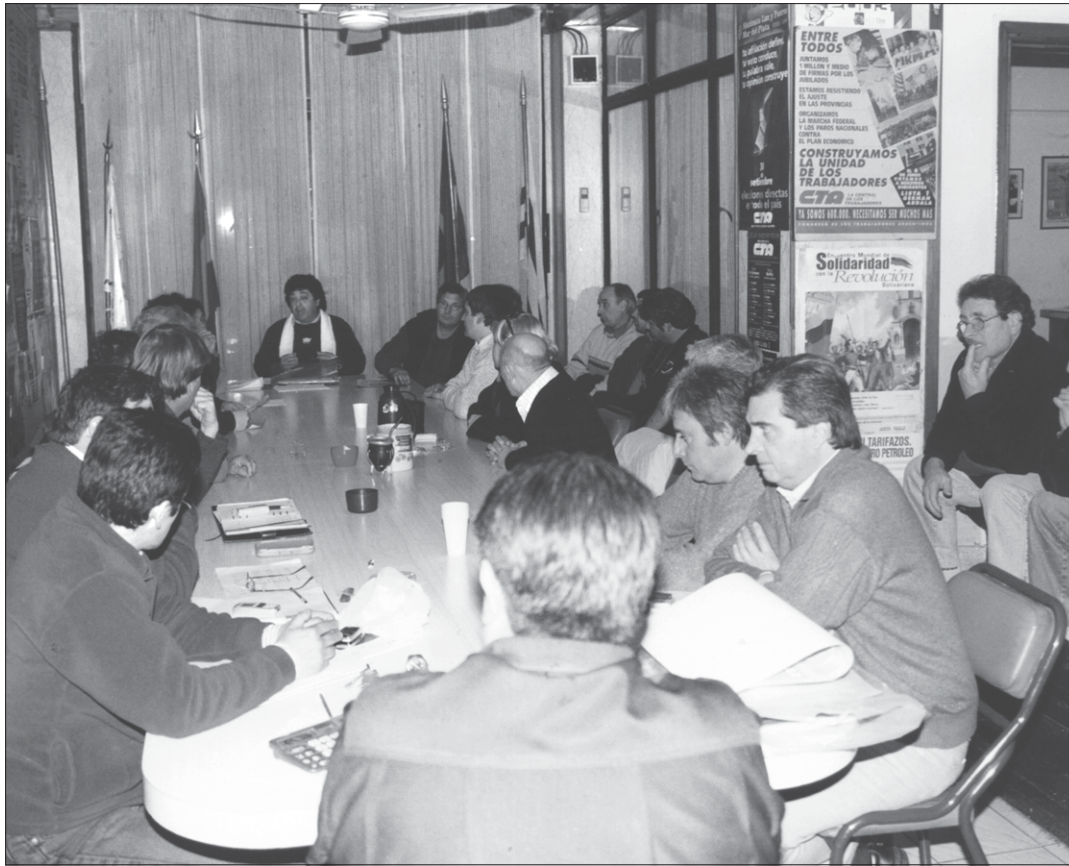
Reunión de los compañeros de la Central "9 de Julio" para debatir por aumento de salarios.

Además de esta situación, los compañeros del sector, a través del sindicato, hicieron llegar al gerente comercial una serie de reclamos sobre la situación laboral que se vive en ese centro comercial. Esta es causa de muchas carpetas médicas ori-