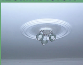
Artefactos en cada ambiente.