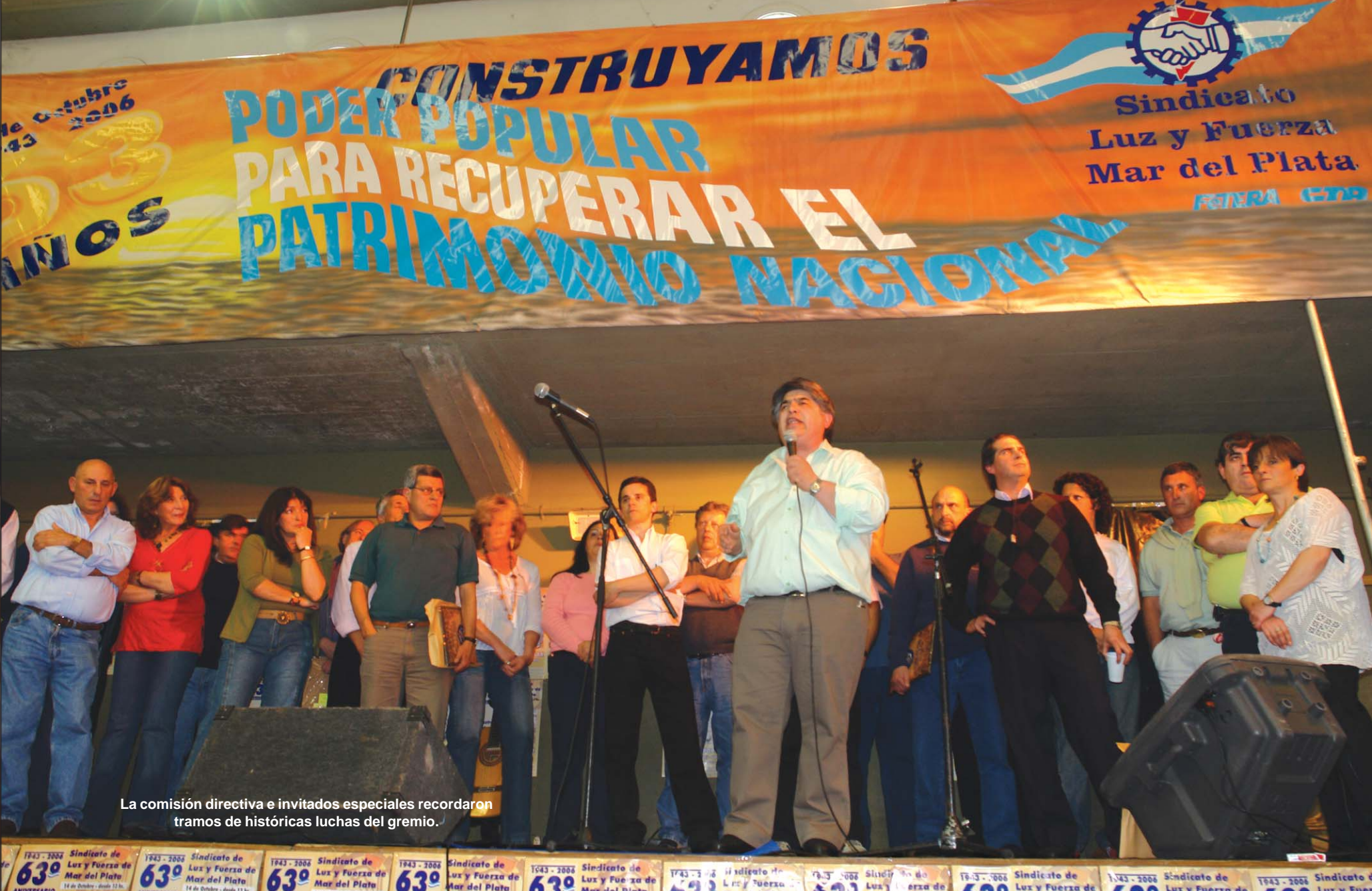
La comisión directiva e invitados especiales recordaron tramos de históricas luchas del gremio.