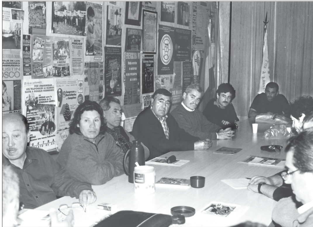
Los compañeros durante la asamblea de delegados del 10 de noviembre último en donde se decidieron medidas de acción en el marco de las problemáticas laborales en las cooperativas eléctricas.

Los compañeros decidieron comenzar con medidas de trabajo a convenio, ya que estos "señores" ni siquiera se presentaron a la audiencia convocada por el Ministerio de Trabajo, concertada para