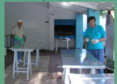
paredes, aberturas y muebles.