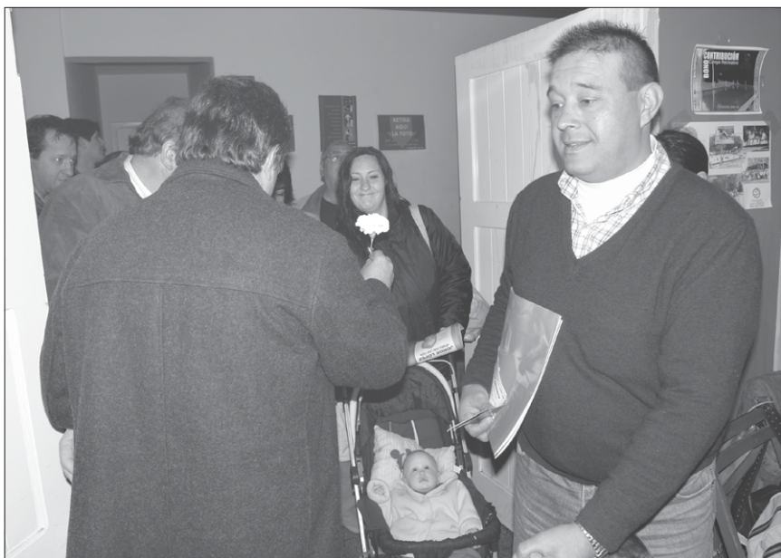
En vísperas del Día de la Madre, un clavel fue entregado a la entrada para homenajear a las mamás presentes.

Y remató: “el camino es la lucha, la organización y la capacidad para transformar y construir un proyecto que nos lleve directo a la liberación definitiva de nuestro país”.