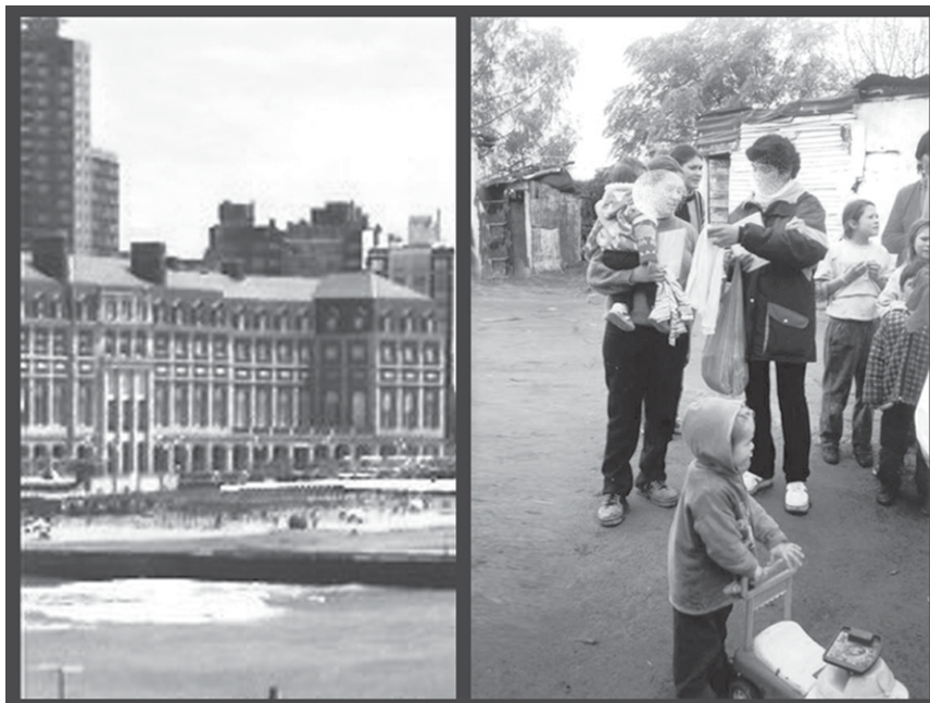
Para la Cumbre se invirtió, para los hoteles 5 estrellas. No serán ellos los que se queden sin suministro cuando haya que seccionar el servicio.

“Yo creo que la Cumbre ya pasó, y que ya pasó un verano. Y ése que vivimos, fue un verano al borde de un colapso. Dependiendo siempre del clima. No hay por qué esperar un verano que no sea exactamente igual. Si no, hay que preguntarse por qué se le exige a Mar de Ajó y Pinamar que inviertan, o alquilen, en