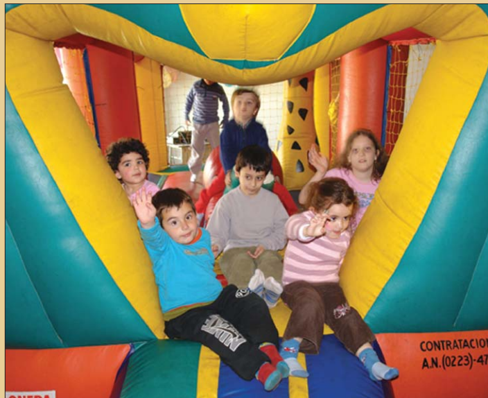
CONTRATA A.N. (0223)-475