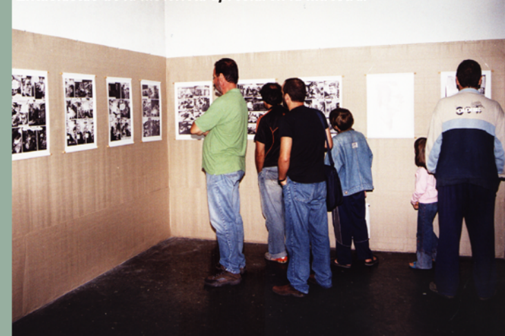
Entusiastas de la historieta apreciaron la muestra.