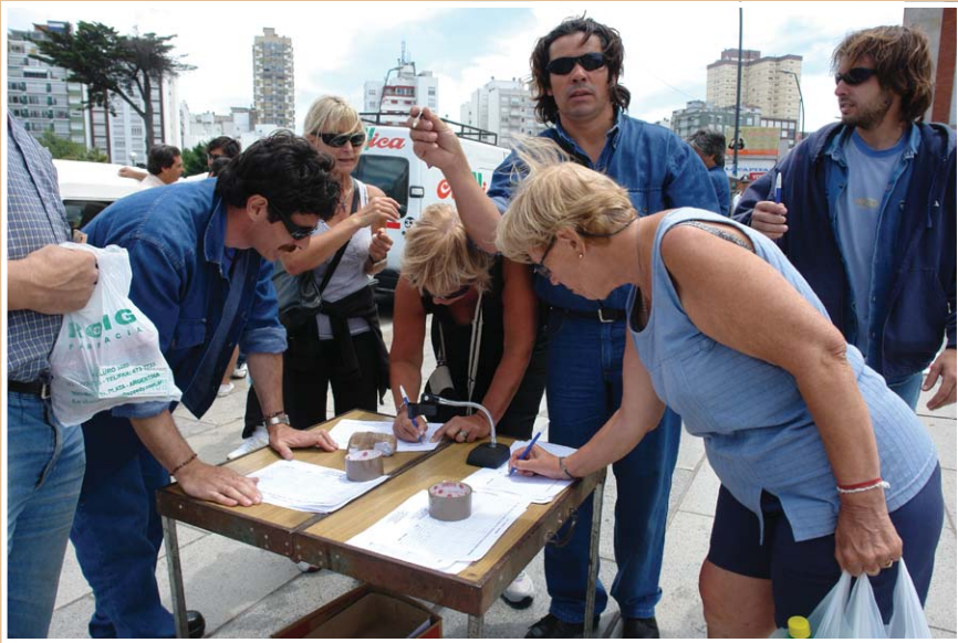
Jornada de protesta en la rambla. Vecinos de Mar del Plata y turistas dejaron su firma en las planillas de la Campaña del Millón de Firmas por la Nacionalización del Gas y Petróleo Argentinos.