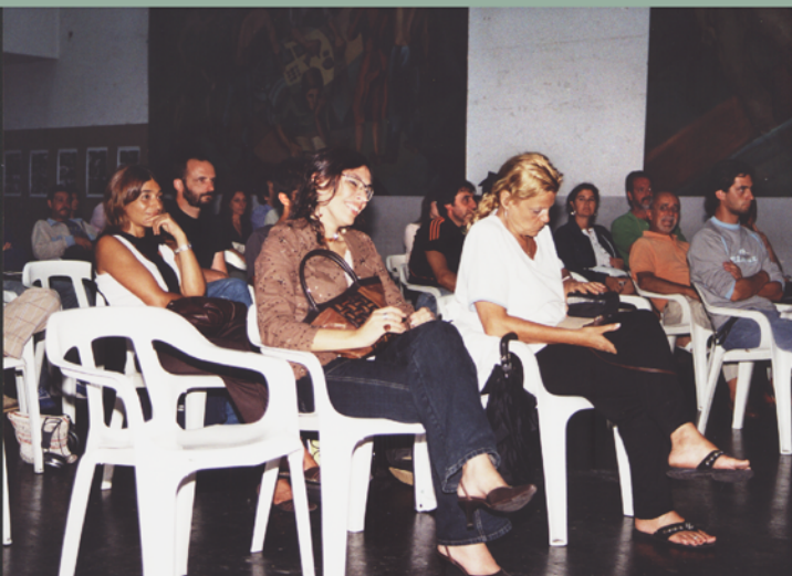
Vista parcial de la concurrencia.

En otro sentido, Solano López hizo público que acercó a nuestro sindicato una serie de dibujos de diversas etapas de su extenso trabajo gráfico, manifestando su disposición a seguir colaborando con la tarea de rescatar memoria y verdad histórica. Su actitud nos compromete. Al maestro, nuestro mayor agradecimiento.