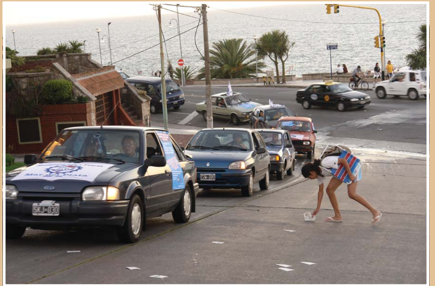
La caravana de vehículos del sindicato recorrió sectores concurridos de la ciudad y concitó gran interés el contenido de los volantes.