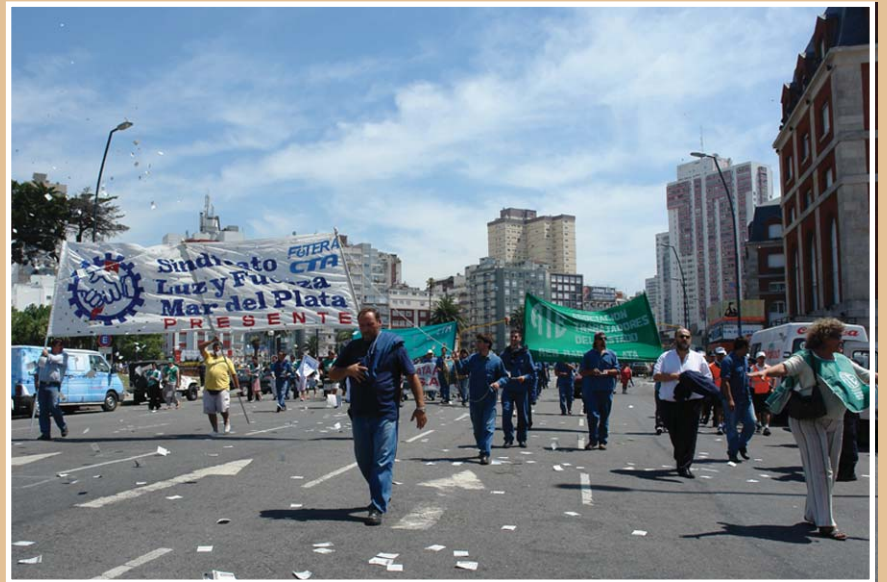
Compañeros del Hotel Antártida, nucleados en ATE, se sumaron a una de las marchas de Luz y Fuerza Mar del Plata.