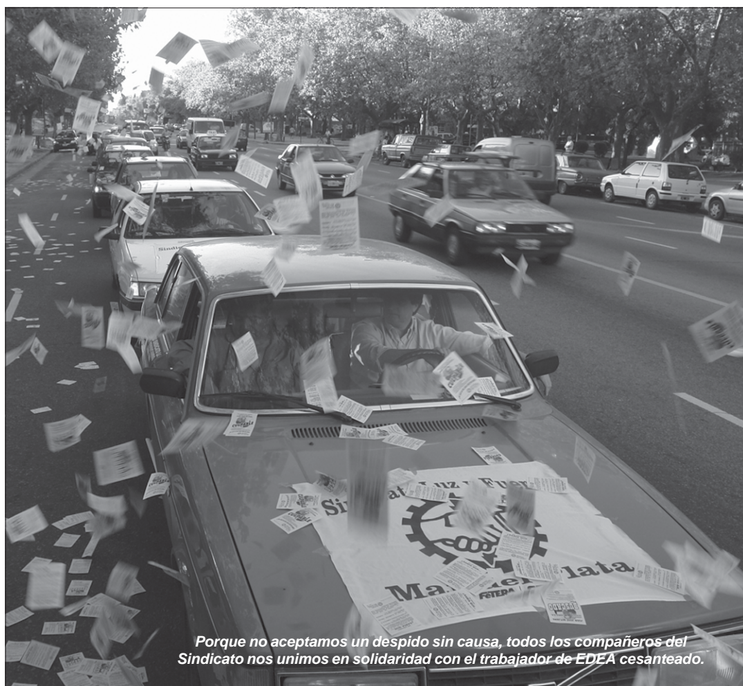
Porque no aceptamos un despido sin causa, todos los compañeros del Sindicato nos unimos en solidaridad con el trabajador de EDEA cesanteado.

¿Entonces algún loquito dentro de la empresa se desubicó con un despido, que no tiene nada que ver con todo esto? ¿O fue el despido un hecho aislado y puntual que no cuenta en esta instancia de la relación? Está claro que no. Está muy claro que detrás de esta injustificada e ilegítima cesantía hay enormes objetivos de la EDEA S.A. como empresa, como parte de un grupo multinacional, y como referen-