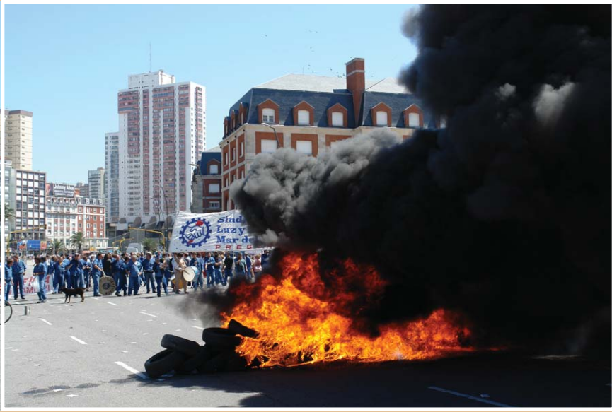
La quema de gomas, la radio abierta, la volanteada, son las armas para poner en alerta a la comunidad sobre los actos de impunidad cometidos por EDEA S.A.