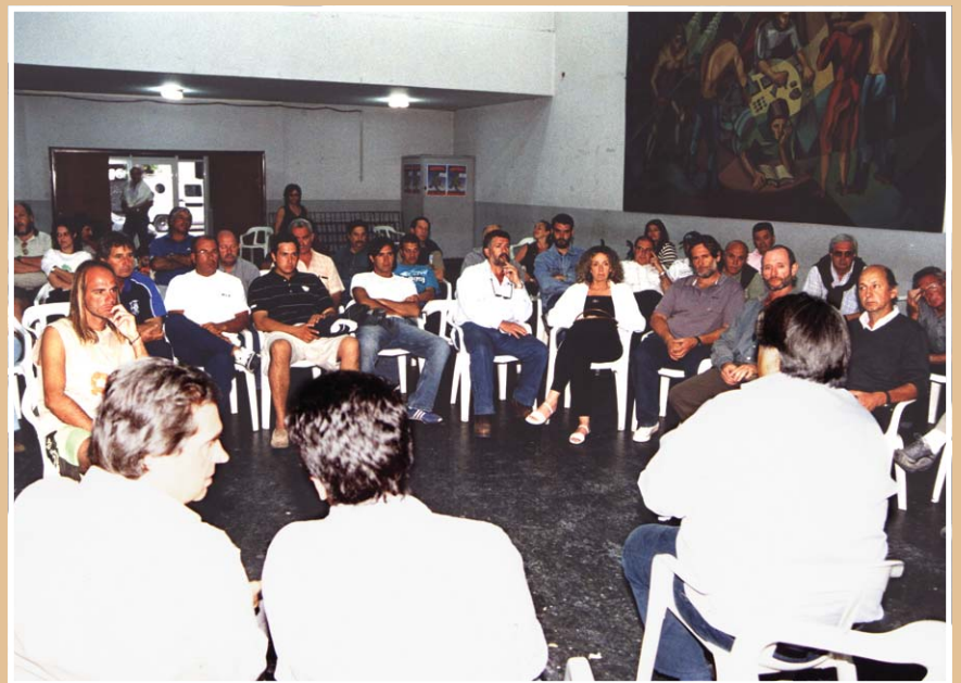
El debate y la lucha. Reunión de Delegados y militantes, con la Comisión Directiva.