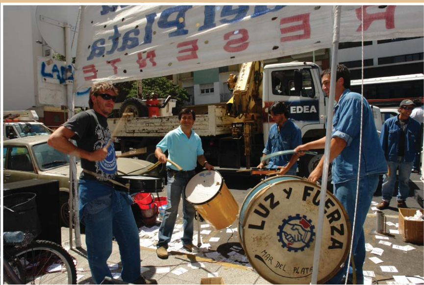
Las banderas y los bombos, grandes protagonistas en la protesta pública de los lucifuerzistas.