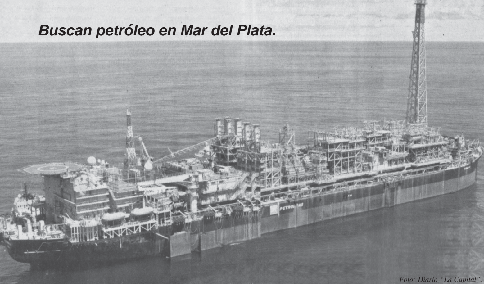
P-48. Plataforma marítima de Petrobras.