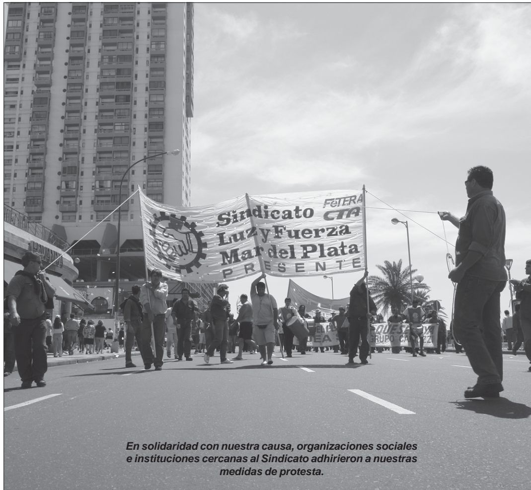
En solidaridad con nuestra causa, organizaciones sociales e instituciones cercanas al Sindicato adhirieron a nuestras medidas de protesta.