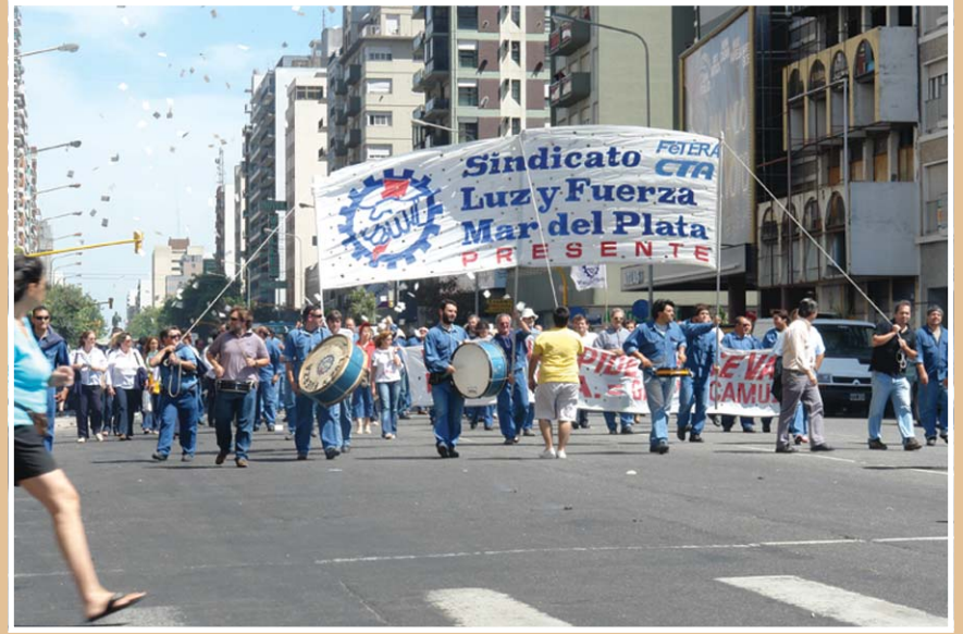
Los paros y las marchas se multiplicaron, en las últimas semanas, como consecuencia del no acatamiento de las disposiciones ministeriales por parte de la empresa EDEA S.A.