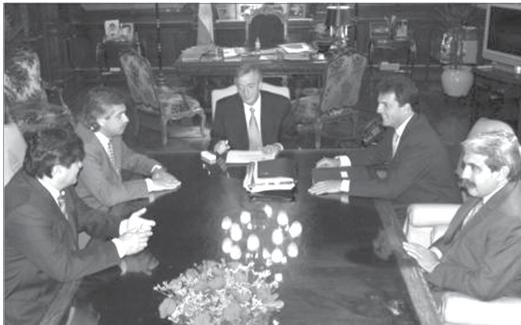
24 de enero de 2007. Casa Rosada, Despacho Presidencial - El presidente Néstor Kirchner se reunió con el titular de la ANSES y miembros del Poder Ejecutivo. Tras el encuentro, se anunció el proyecto de ley que establece la libre opción jubilatoria.

Reforma o emprolijamiento del negocio de las AFJP. El proyecto oficial que habilita el traspaso desde las AFJP al Sistema de Reparto deja más dudas que certezas y el propio ministro de Trabajo, Carlos Tomada, se encargó de regarlas cuando, acosado por las críticas de economistas liberales, dijo que el gobierno se propone “un esquema de complementariedad y no de desplazamiento”. Procurando que “la gente pueda tener información para elegir la opción que más le conviene”.