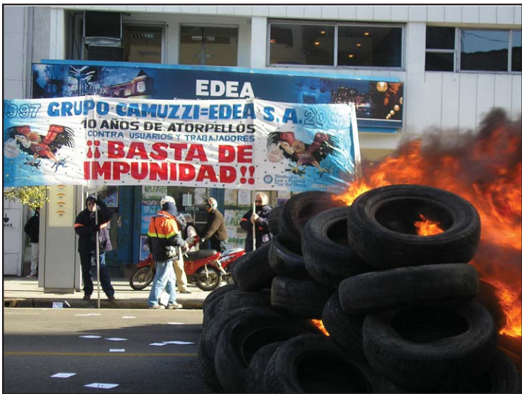
Ante las puertas de EDEA, continuamos con el reclamo por un aumento salarial y el fin de la impunidad.

cia, en este caso al Ministerio de Trabajo. Como dicen los 'considerandos' de la Resolución de la conciliación obligatoria, la empresa le pide al Ministerio en una carta documento del 2 de agosto que intervenga en el conflicto. Y sin embargo, planteada la posición de las partes, demostró en esta audiencia que no está dispuesta a dar un paso adelante».