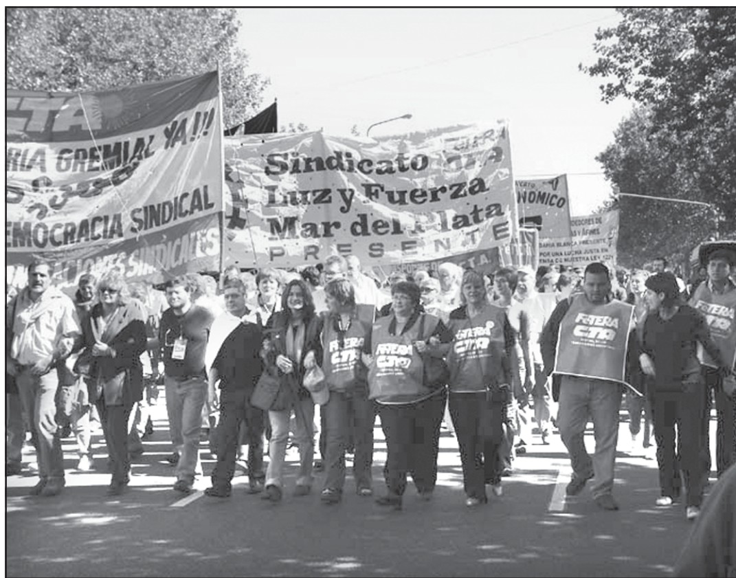
El martes 28 marcharemos para que la distribución del ingreso en la Argentina forme parte de la agenda social, y en reclamo por la personería gremial de la CTA, demorada por la CGT y el gobierno.

«Se trata de una acción que protagonizaremos en demanda de un programa amplio que garantice una justa distribución de la riqueza. Reclamamos una paritaria social que significa convocar a un espectro multisectorial para definir políticas que avancen hacia una mejor calidad y recomposición