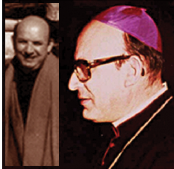
Monseñor Enrique Angelelli y un Justo homenaje.

El fundador de la CTA, rescató la capacidad del pueblo organizado para sobreponerse a la adversidad, para exigir justicia y luchar contra la impunidad en los