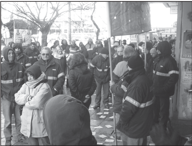
El conjunto de los trabajadores manifestamos frente a EDEA S.A. de Independencia y Luro, los abusos cometidos por la empresa.

la recomposición salarial para el año 2007, que las entidades gremiales plantearan en el ámbito correspondiente (negociación paritaria). Asimismo, ocasiona estas medidas de acción directa la situación laboral en que se encontrarían numerosos trabajadores que perciben remuneraciones inferiores a las de CCT 36/75, toda vez que la empresa EDEA S.A. terceriza o subcontrata con terceras empresas, numerosas tareas que resultan normales y habituales al desempeño del servicio eléctrico que debe prestar la empresa EDEA S.A. y que incluso se encuentran incluidas y descritas en el CCT 36/75, tal como lo reconoce con carácter de declaración jurada la propia empresa EDEA S.A.».