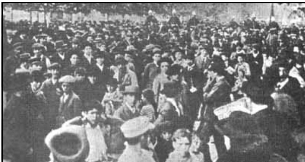
1909. Manifestación anarquista en la Plaza de Mayo. Al fondo, pueden verse los efectivos de la policía montada.