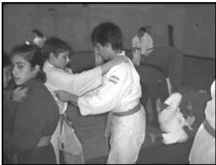
Los judokas Infanto-Juveniles en pleno entrenamiento durante el Campus.