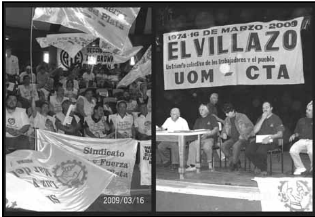
Presencia lucifuercista marplatense en los 35 Años del "Villazo".