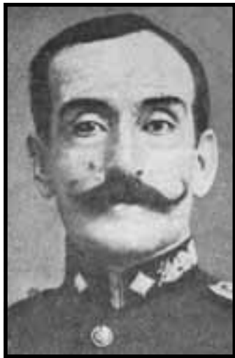
Cnel. Ramón Falcón, jefe de la policía.

obrero. Tal como venía ocurriendo se organizaron dos manifestaciones, una convocada por los anarquistas y otra llamada por los socialistas. Los primeros concentrarían a las 15hs en plaza Lorea y los segundos en Plaza Constitución. Entre los gremios participantes de plaza Lorea se encontraban los del rodado, los caldereros. Los zapateros, herreros y panaderos. Cuando la columna integrada