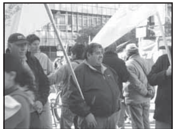
Marcha Nacional de la CTA por la Libertad y la Democracia Sindical. También se realizó en Mar del Plata una marcha por las calles céntricas de la ciudad, deteniéndose frente a la sede local del Ministerio de Trabajo, donde se realizó un acto público.