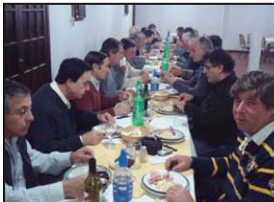
Festejo y Brindis en Delegación Dolores.