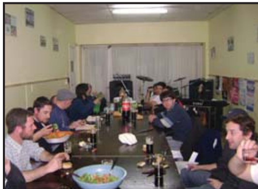
Aspectos del festejo en la Delegación Vidal.