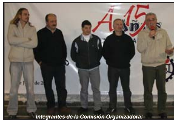
Integrantes de la Comisión Organizadora:

A TODAS Y TODOS, NUESTRO AGRADECIMIENTO.