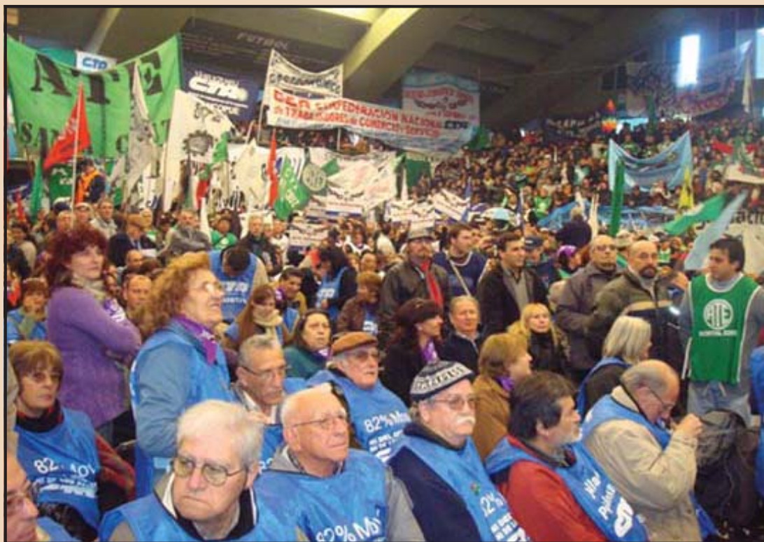
31 de julio. Plenario Nacional de la Agrupación Germán Abdala en el miniestadio de Ferro.

Argentina está inmersa en este sistema capitalista, no tiene otra opción ni otro camino que cambiar, desarrollar iniciativas políticas que nos habiliten una construcción que nos permita a todos vivir dignamente. La Central tiene un papel estratégico que jugar en esta dirección y en esa construcción, por eso está en disputa, no por nosotros los trabajadores. Está en disputa por los poderes que quieren someter a la Central. Está en disputa por las políticas posibilistas, de sometimiento y que