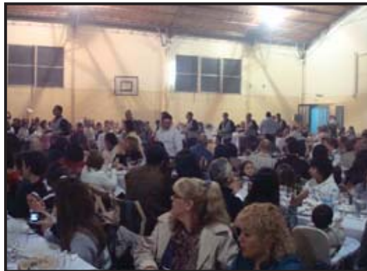
El festejo en la Delegación Balcarce.

Hoy, con el orgullo de haber resistido, salir fortalecidos en la unión, en la solidaridad y con la dura certeza de haber tenido razón en lo dañina que iba a ser la política neoliberal de privatizaciones, desde estas páginas volvemos a saludar a todo el gremio de la energía por nuestro «Día del Trabajador de la Electricidad»: ¡MUCHAS FELICIDADES, COMPAÑERAS Y COMPAÑEROS!