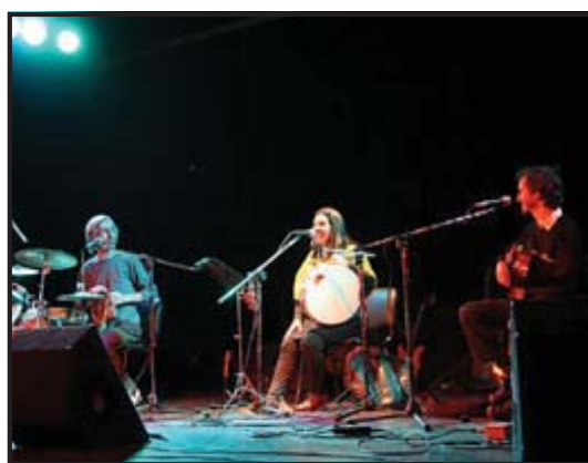
Agrupación folclórica Purazambo.