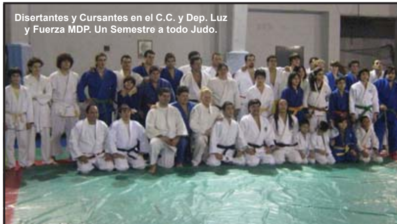
Disertantes y Cursantes en el C.C. y Dep. Luz y Fuerza MDP. Un Semestre a todo Judo.