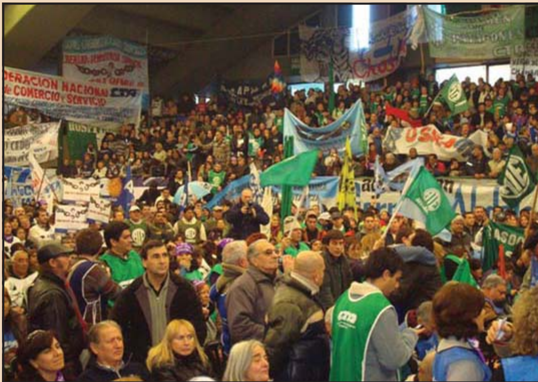
31 de julio. Plenario Nacional de la Agrupación Germán Abdala en el miniestadio de Ferro.

ha posibilitado crecer en el desarrollo de la libertad y la democracia sindical cuando resolvió el fallo de ATE, el de Rossi y otros. Es decir, que queda claro entonces, que hay una decisión política de que los trabajadores no puedan organizarse como quieren. Por eso cada vez que queremos armar organizaciones nuevas hay persecución, intimidación y despido. Esas son las políticas que intentan prohibirnos ser nosotros mismos y contra eso batallamos, contra eso peleamos y estamos absolutamente convencidos que solo cuando logremos esa libertad y democracia sindical, vamos a poder desarrollar lo que necesitamos en cada lugar, y no es que renunciemos a la personería gremial, pero no tiene el valor de antaño, tiene un valor secundario a la hora de las circunstancias que vivimos. No la menospreciamos, pero no nos vamos a arrodillar por ella. Vamos a pelear por ella.