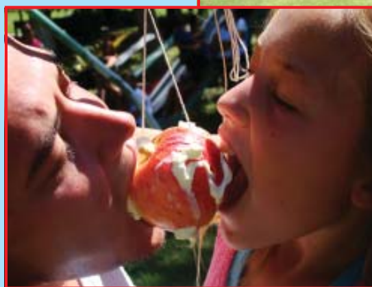
Toda la familia interviene en el juego de la manzana.