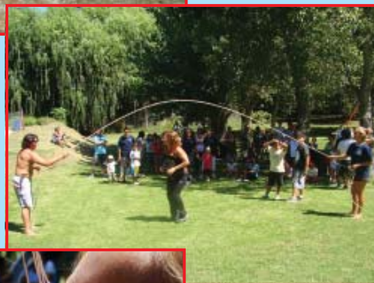
Cierre con todo. Saltando la soga bajo el sol del Campo Recreativo.