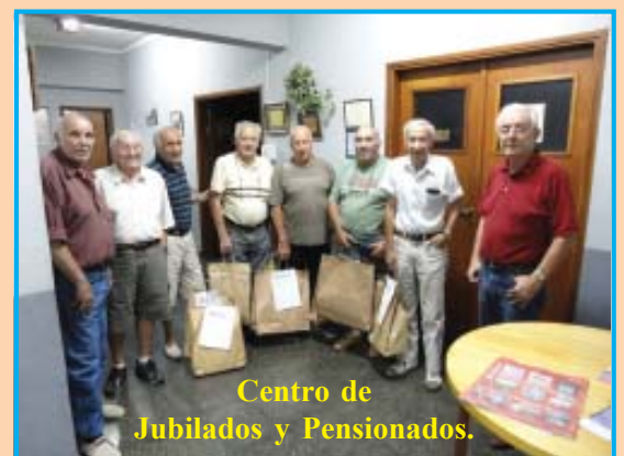
Centro de Jubilados y Pensionados.