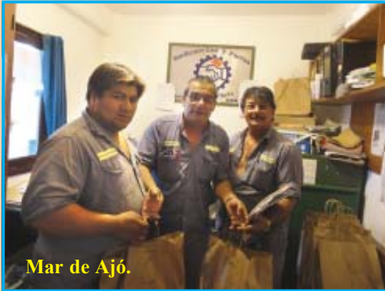
Mar de Ajó.