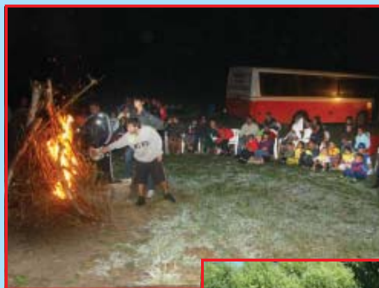
Actividad nocturna alrededor de la fogata.

En esta edición también se eligieron los mejores colonos de las tres divisiones etáreas que funcionan en la Colonia, además del mejor colono general. La elección se realizó en el marco de una chorceada familiar.