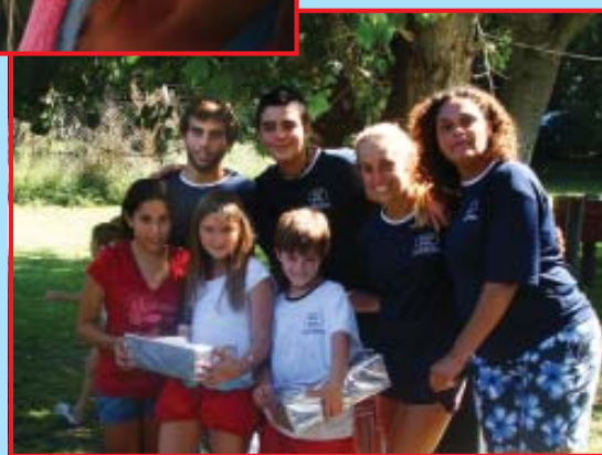
Distinciones otorgadas a colonos y colonas.