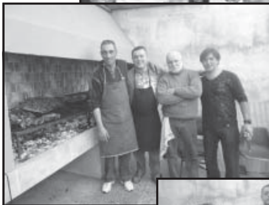
Asadores y mozos hicieron gala de maestría. Y la remera del día: “Yo vi al Flaco Secretario General”.