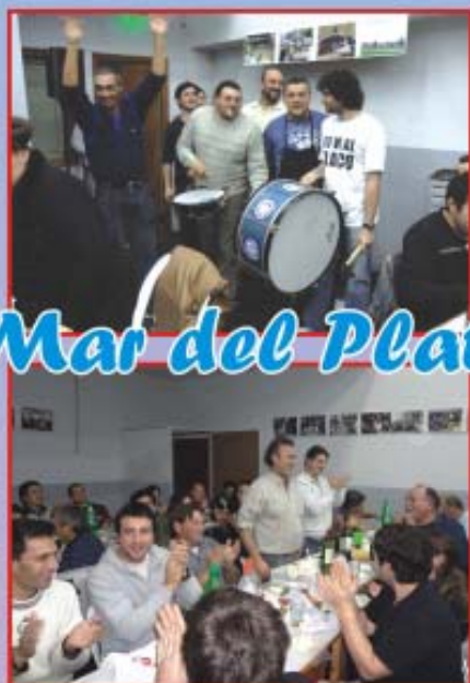
Mar del Plata