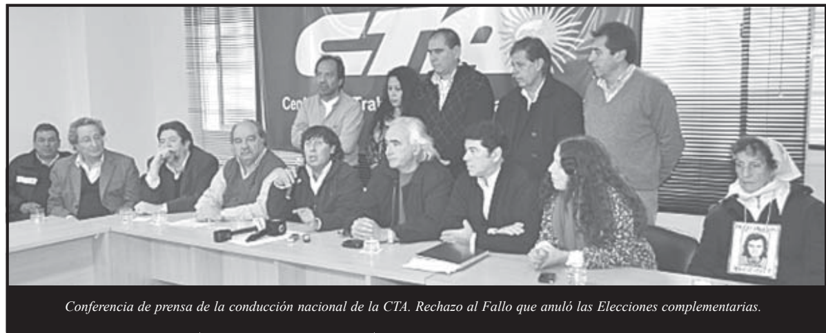
Conferencia de prensa de la conducción nacional de la CTA. Rechazo al Fallo que anuló las Elecciones complementarias.