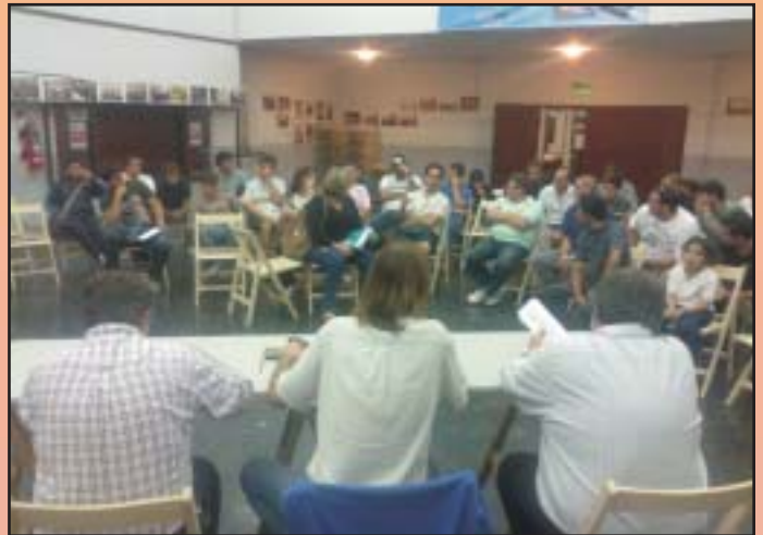
13 de marzo. Con trabajadores/as de Central 9 de Julio.