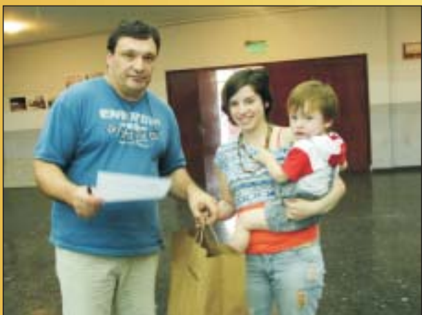
El salón de Actos de nuestro Sindicato fue el lugar donde se concentró la actividad de entrega de Útiles para el período lectivo 2012.