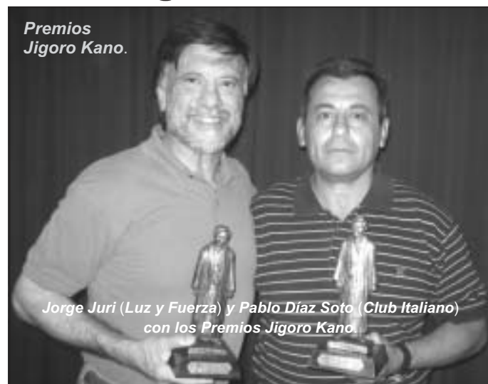
Premios Jigoro Kano.