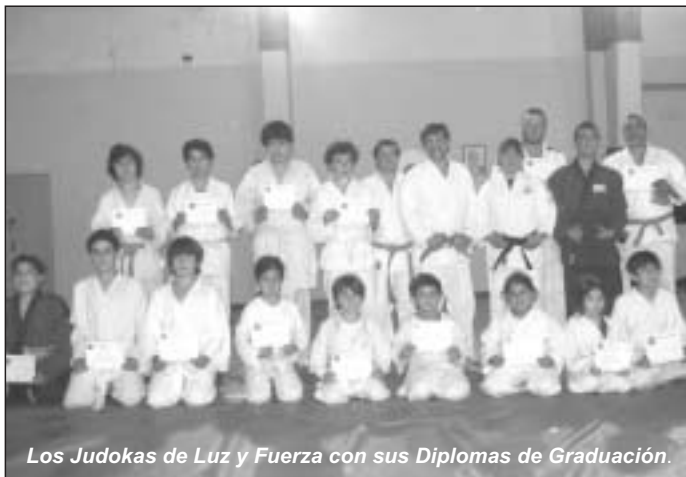
Los Judokas de Luz y Fuerza con sus Diplomas de Graduación.