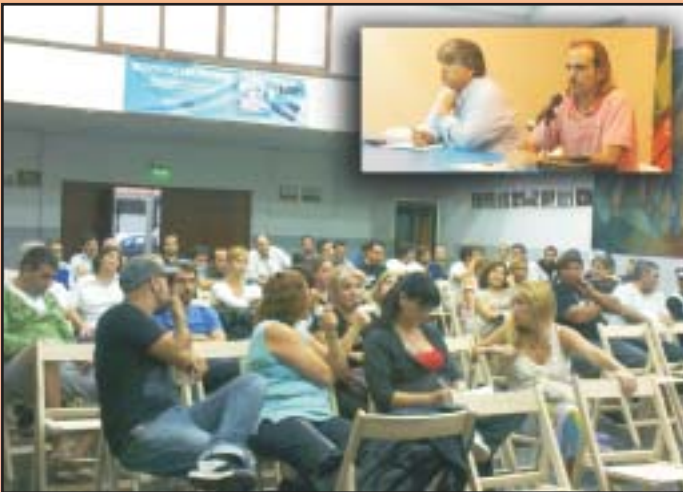
12 de marzo. Con trabajadores/as de EDEA S.A.

SE VIENEN REALIZANDO EN DISTINTOS LUGARES DE TRABAJO, CON INTEGRANTES DE COMISIÓN DIRECTIVA.