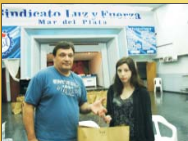
Todas las Familias, de todos los sectores de trabajo de Mar del Plata, tuvieron su Bolsa de Útiles correspondiente al año en curso.