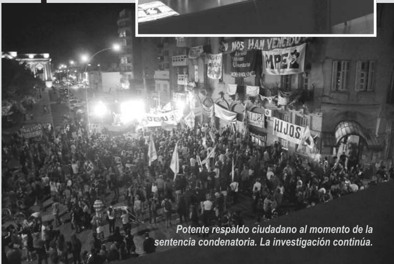
Potente respaldo ciudadano al momento de la sentencia condenatoria. La investigación continúa.