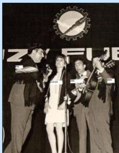
Festival de Folclore de Río Hondo (1967). El conjunto musical “Las Voces de Luz y Fuerza” quedaron en segundo puesto.