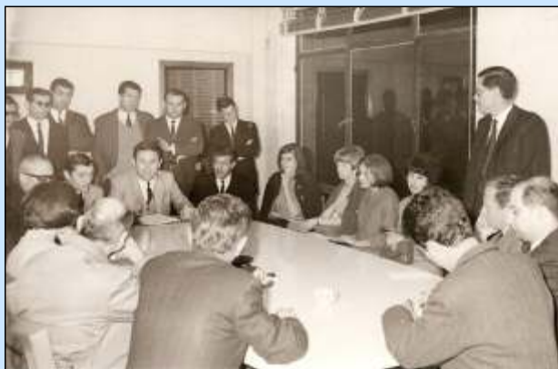
Reunión sindical en la que participaron representantes de la FATLYF (1965).