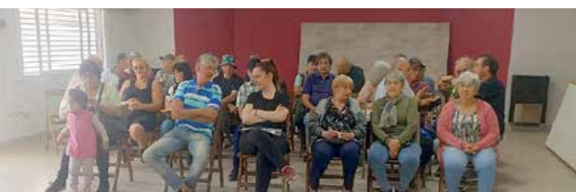
Asesoramiento a jubilados/as de Mar de Ajó.