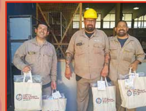
CENTRAL 9 DE JULIO