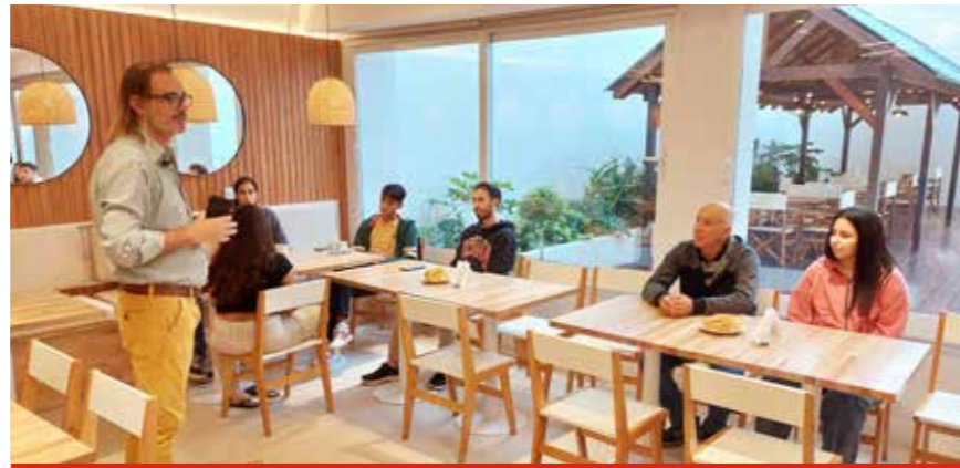
Ingreso de becados en el Hotel, 2024.

“Un gremio debilitado lo único que hace es ser carne de estas políticas que les hacen mal a los trabajadores”