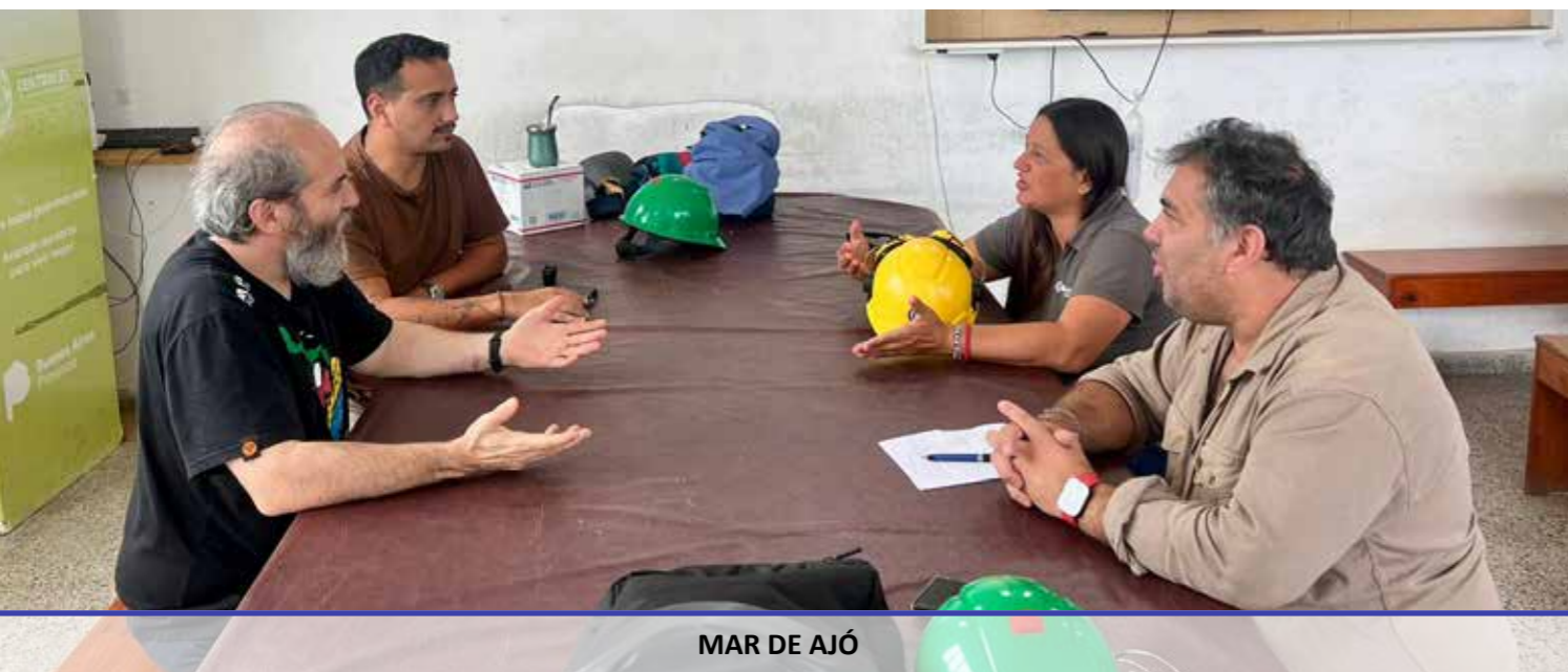
MAR DE AJÓ