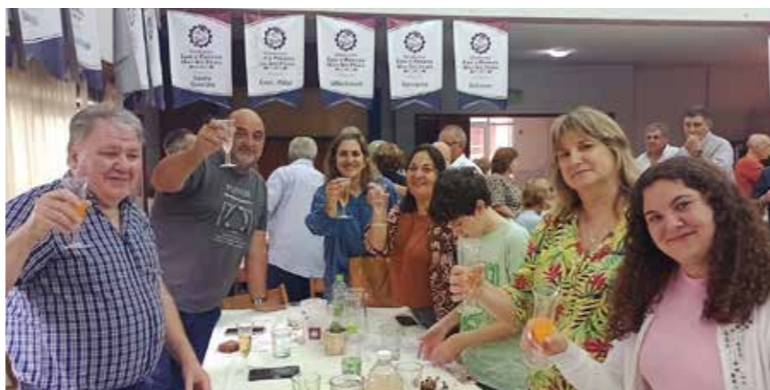
Festejos por el día del jubilado/a lucifuerista.