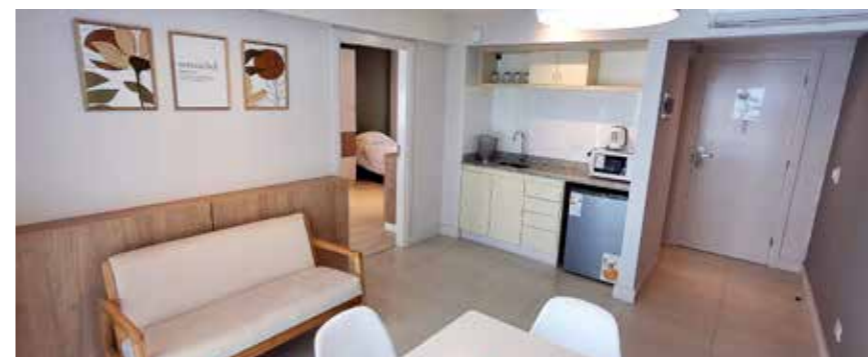
Interior de una de las habitaciones del hotel.