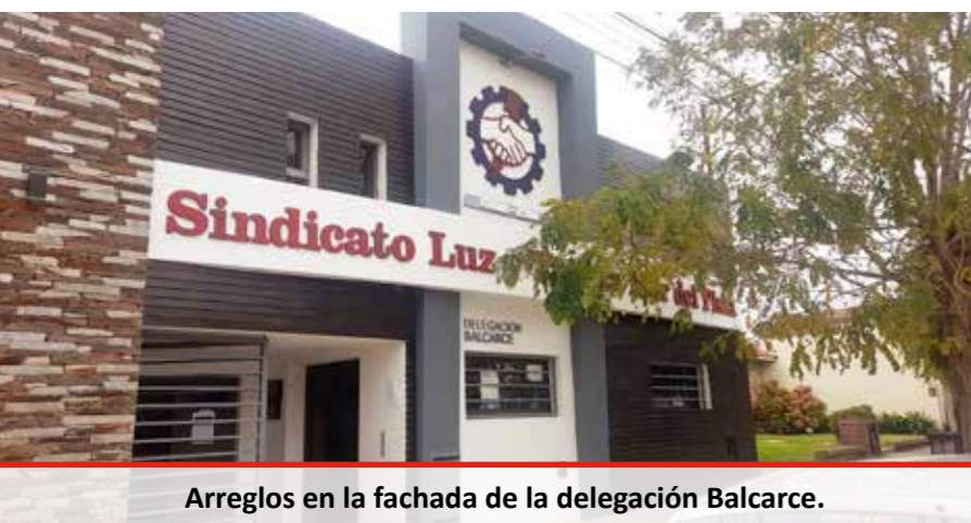
Arreglos en la fachada de la delegación Balcarce.

Sin dudas el actual es un periodo positivo para el gremio, considerando el importante crecimiento institucional y patrimonial logrado en estos casi tres años de conducción.