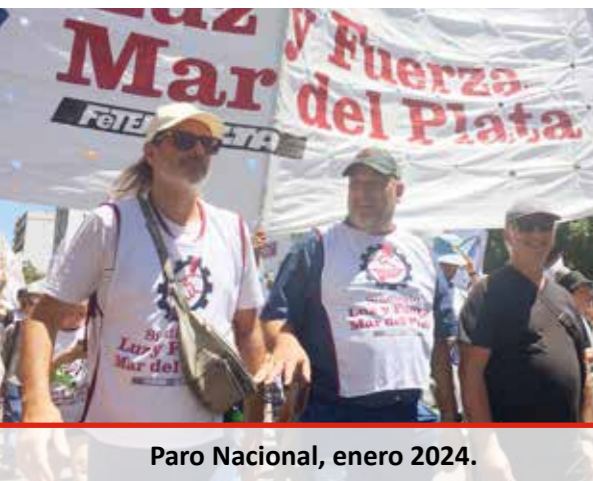
Paro Nacional, enero 2024.