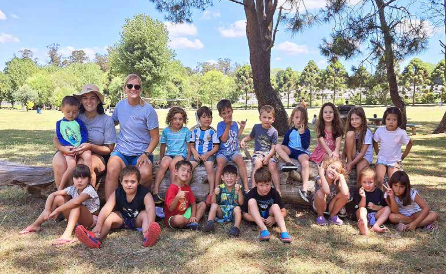
GRUPO 1 - PROFE ROCÍO / COORDINADORA LUCÍA