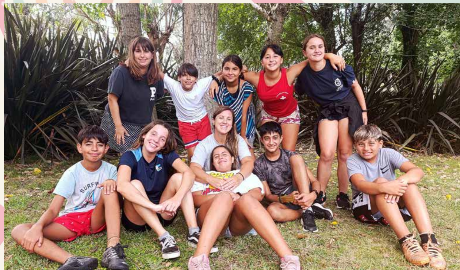
EGRESADOS DE LA COLONIA 2025