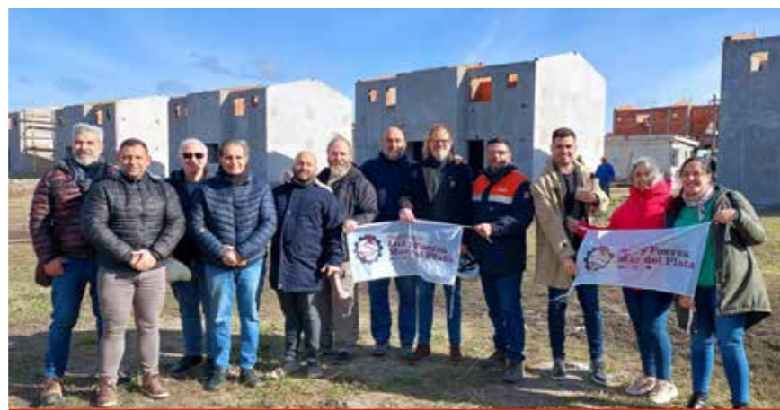
Avances en el Plan de Viviendas durante el 2023.