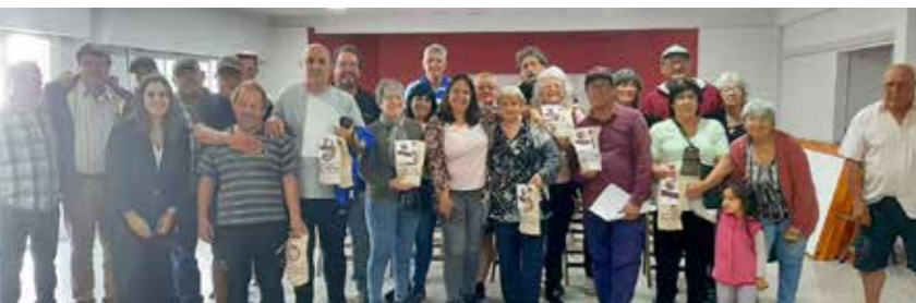
Asesoramiento a jubilados/as de Mar de Ajó.