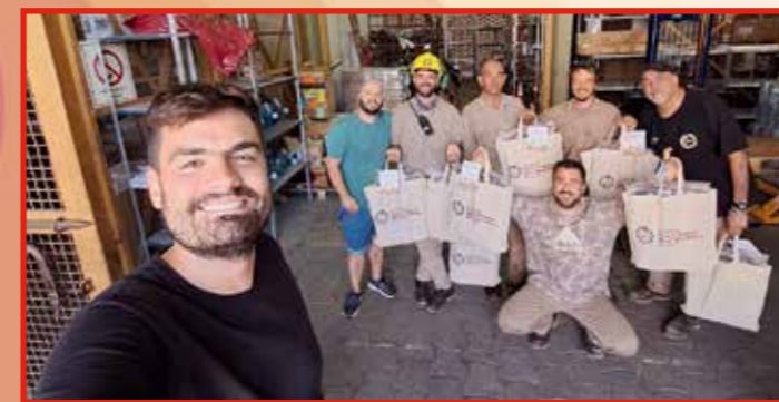
CENTRAL 9 DE JULIO