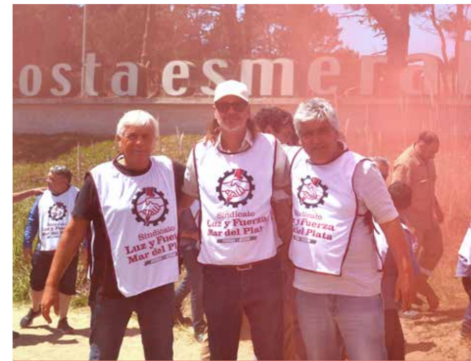
Mobilización en Costa Esmeralda, 2024.

Debe ser el histórico y el que sostuvimos estos años, que está en nuestro ADN. Este siempre ha sido un gremio de lucha, estuvimos en las calles no solamente participando de los paros, también en la marcha de apoyo a los jubilados, contra el mega DNU y la ley Bases, estuvimos en las marchas por la educación pública, vapuleada desde