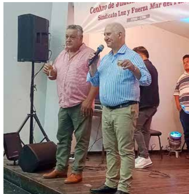
Festejos por el día del jubilado/a lucifuerista.