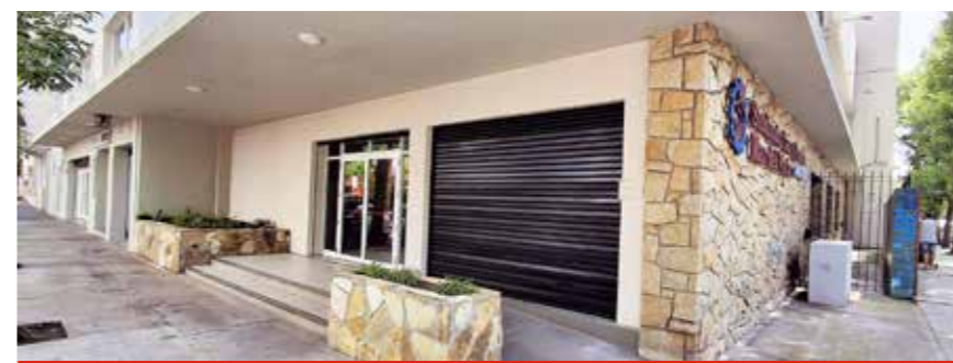
Pintura y reparaciones del exterior de la sede MdP.

Seguimos apostando al futuro de la familia lucifuerista con inversiones en el Campo Recreativo, en beneficio de nuestros afiliados, familia e invitados. Esta temporada tenemos un predio mucho más moderno y equipado, como detallamos en esta misma revista. Instalaciones acorde a las necesidades de nuestros visitantes.