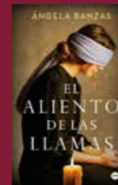
Ángela Banzas "El aliento de las llamas"

Escaneando el QR podés conocer más sobre éstos y otros títulos recién llegados a la biblioteca.