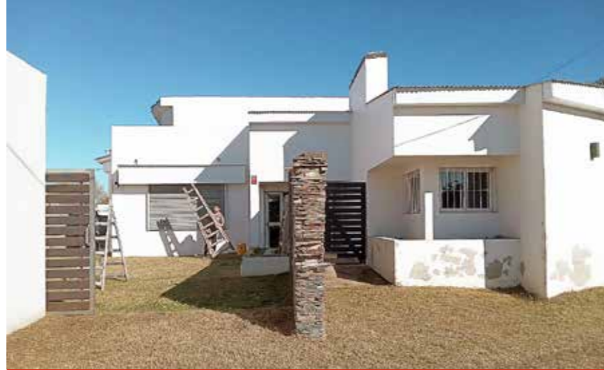
Reparaciones en la delegación Mar de Ajó.

Nuestro Hotel tiene un plantel de nueve compañeros trabajadores en forma directa y otros tantos en forma indirecta, por cual es necesario contar con estos acuerdos para sostener salarios, gastos de servicios, mantenimiento e insumos. Otra inversión que estamos en proceso de concluir es el recambio de los vehículos gremiales, que cuentan con muchos kilómetros y no son convenientes para la seguridad en los viajes que de-