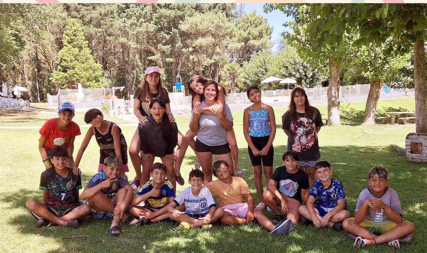
GRUPO 3 - PROFE VICKY