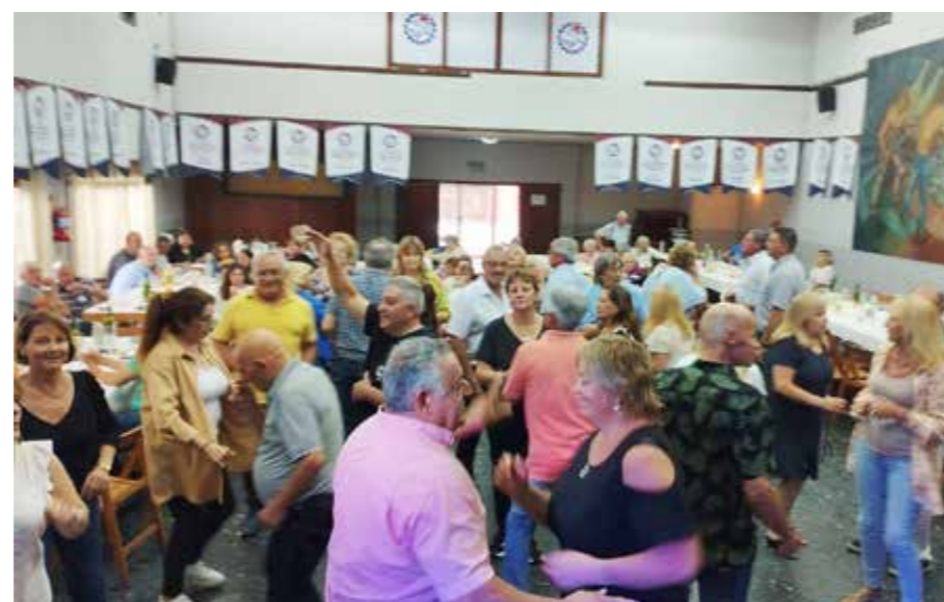
Festejos por el día del jubilado/a lucifuercista.

El 24 de noviembre se conmemoró en todo el país el "Día del Jubilado lucifuercista", fecha creada en 1974 a partir de la primera "Comisión Nacional de Jubilados de Luz y Fuerza".