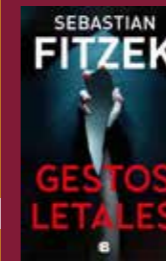
Sebastián Fitzek "Gestos letales"