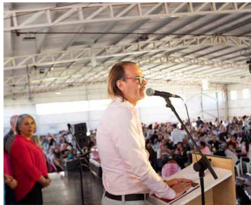
Festejos 80º aniversario.

Tenemos un vínculo muy bueno con todos los delegados y las delegadas. No sería posible gestionar en una jurisdicción tan amplia si no pudiéramos articular con ellos. El rol del delegado es fundamental. Yo fui muchos años delegado y puedo dar fe de eso. Es la