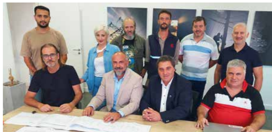
Firma del Plantel con Coop. Balcarce, 2024.