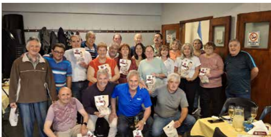
Festejo de los cumpleaños de los últimos meses.