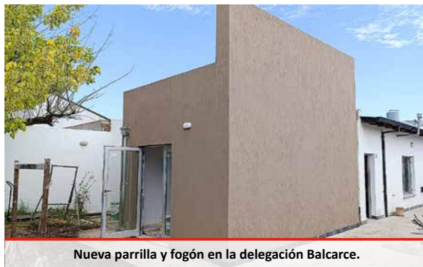
Nueva parrilla y fogón en la delegación Balcarce.

ben realizar los integrantes de la Comisión Directiva. Adquirimos un auto Toyota para la Secretaría General y un utilitario Citroën para cargar insumos y herramientas, traslado de equipos y folletería en las movilizaciones y estamos pagando un plan por otra unidad que va a ser utilizada para viajes. Además adquirimos un motocarro eléctrico para el Campo Recreativo para traslado de materiales, herramientas e insumos y que por ser eléctrico es cero emisiones tóxicas, no hace ruido y está acorde con la naturaleza y el medio ambiente. Este fue un breve repaso de las principales gestiones. Queda claro que en estos años realizamos muchísimas obras y concretamos muchísimos proyectos. Los cambios están a la vista de las y los compañeros de toda la jurisdicción. No prometimos nada, solo cumplimos.