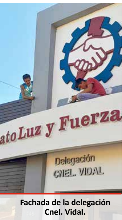
Fachada de la delegación Cnel. Vidal.