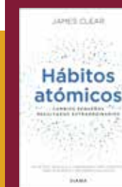
“Hábitos atómicos” James Clear