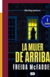
“La mujer de arriba” Freida McFadden