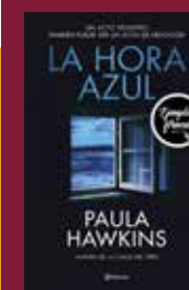
“La hora azul” Paula Hawkins